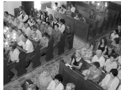
Zselyken a háromszáz lélek már tengert jelent. Ölelkező emberek, kézfogások színtere a templomtér.

Besztercétől 24 kilométerre délnyugati irányban, a Sajó patak völgyétől balra, Sajónagyfalu, Szentiván, Péntek, Nagyida, Dipse és Fehéregyháza határai közt, egy katlanszerű mélyedésben fekszik Zselyk. A völgyet magas dombok veszik körül, és meredek utakon lehet csak a faluba jutni Fejéregyháza vagy Sajónagyfalu felől.