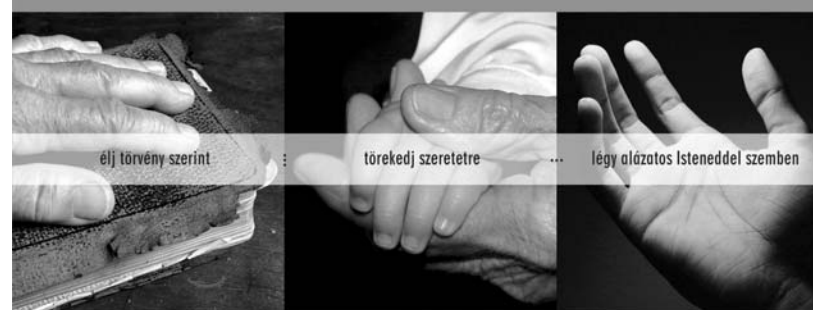
élj törvény szerint

„Ember, megmondta neked, hogy mi a jó, és hogy mit kíván téled az Úr! Csak ezt, hogy élj törvény szerint, törekedj szeretetre, és légy alázatos Istennel szemben.”