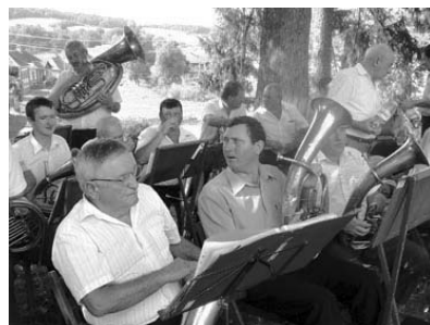
Német hagyományból származhatnak a turnírok – rézfívósok –, akik legjobban kitartottak a falu hagyományápolásában

Am a demográfia kegyetlen tud lenni. Zselyken minden harmadik ház üres, hétköznap jobbára csak öregek tesznek-vesznek a faluban, no meg a gyárak felszámolásával hazatért nagyszülőkorú zselykiek. Összesen hatvanan-hetvenen.