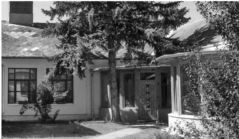
A Kapernaum bejárata – lapzártánk délelőttjén

ra. De gondolhatunk azokra a szolgálatban álló lelkészekre és civil gyülekezeti vezetőkre is, akik ezeken a konferenciákon kapták vagy érezték meg döntő módon elhivatásukat. Ebben az értelemben a „gyenesi gyerek” fogalomra vált a teológushallgatók között. Nem volt titkolt ez a cél a nyolcvanas években, hiszen abban az időben hatalmas lelkesíthány és a jövő felőli bizonytalanság jellemezte egyházunkat.