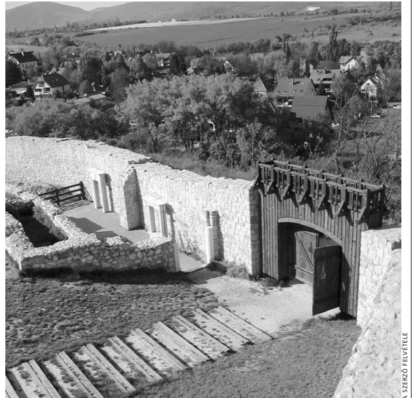
A solyvári Szarkavár részlete

Pusztulása az oszmán sereg kiűzésekor kezdődött, amelynek során Lotaringiai Károly 1684-ben megostromolta. Kőveit a környék újonnan érkezett telepe-