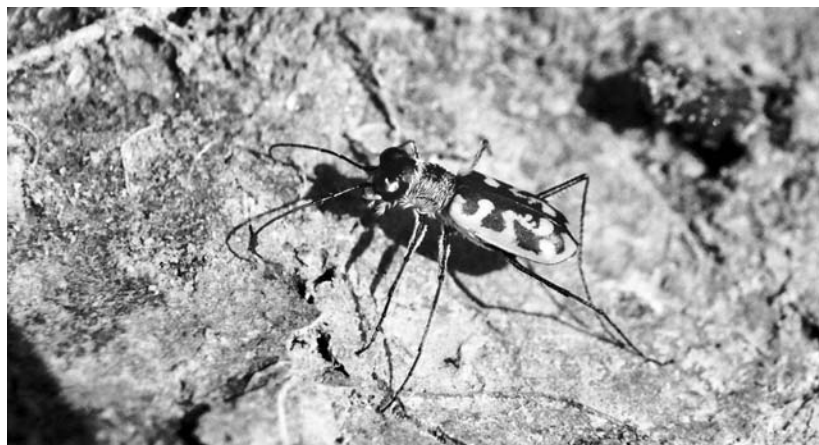
Cicindela elegans – Erdélyben Friedrich Schwab fedezte fel

A csillagászat iránti érdeklődését az 1874. évi üstökös keltette fel. Ezen a területen leginkább az úgynevezett változócsillagok észlelését kötik a nevéhez. A megfigyeléseket már Marburgban elkezdte, majd Kolozsváron folytatta,