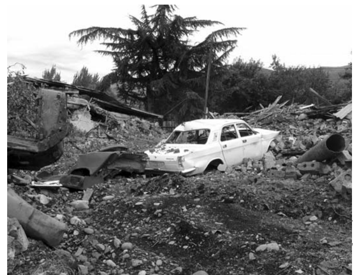
Volt település Chinvalitól északra

A Magyar Ökumenikus Se- gélyszervezet itt, Dél-Osztétában fog segíteni az ellátásban és az el- helyezésben. A tervek szerint a négy szervezet Grúziában és Dél- Osztétiaiban összesen nyolc-tíz- milli dollárt használ majd fel.