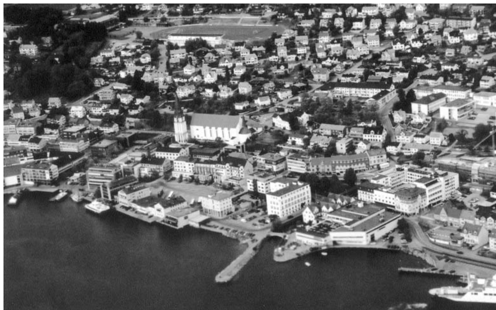
A norvégiai Molde városa repülőgéptávlattól – középen a székesegyház, a püspökszentelés helyszíne

Az ifjúság körében népszerű a KIE-központ, amelyet a helyi gyülekezet is használ. Ottjártunkkor norvég–magyar estet tartottak, amelyen a két gyülekezet kapcsolata állt a középpontban. Úgy tűnik, hogy együttműködésünk első gyümölcse az ifjúsági munká-