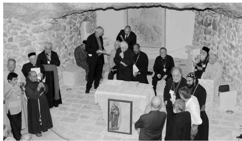
A konferencia résztvevőinek egy csoportja a Saul pálfordulásának helyszínén emelt templomban

zás örömeivel. A világnak ezen a táján, ahol keresztény mártírok sora és értelmetlen háborúk áldozatainak sokasága jelzi a „Ne ölj!” parancsolat elleni vétek gyakoriságát, együtt kell élni és gondolkodni a másként hívőkkel az ellenség szeretetének mindennapi gyakorlatában.