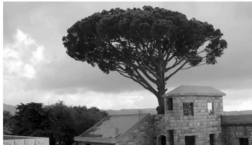
Magányos cédrus a bejrúti öböl magaslatán

Christian Krause, a Lutheránus Világszövetség korábbi elnöke úgy fogalmazott, hogy amit a keresztény nagy egyházak nem tudnak elérni – a keresztény egység előbbre vitelét –, azt az egyház