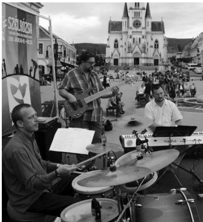
Zenekari oldalméret Kőszeg főterén – a Szérlőzsa az utcára is kivonult

Jelenleg is számos tehetséges evangélikus fiatal áll össze zenekarba, kórusba, és megérezésem szerint nem mondanának nemet egy-egy utcai szolgálatra. Mindent azonban meg kell szervezni: a technikát, az engedélyeket – ez a zenekarok vezetőinek sokszor már erőn felüli feladat. De egy Jubál fesztiválon, egy solymári gospel-fesztiválon – és még sorolhatnám – természetesen ott vannak egyházunk fiatal muzsikusai. Az említett táborunkkal kapcsolatban pedig vannak már határozott elképzeléseink arról, hogy a képzést záró úgynevezett vizsgakoncerteket majd mi is az utcán tartjuk.