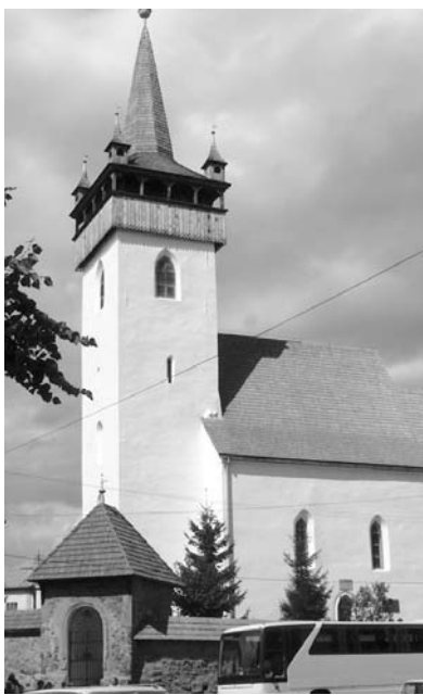
A husztai református templom

A Petrőczy Kata Szidónia és férje emlékére állított mellett egy másik kopjafa a husztai születésű Nagy-Iday Éva emléket örökíti meg, aki Himnuszunk költőjének dédanyja volt. A harmadik kopjafa Bethlen Gábor erdélyi fejedelem és testvére, Bethlen István főispán emléket hirdeti. Mindketten jótévői voltak a husztai gyülekezetnek is. Utóbbi főispánsága alatt poraiból építette újjá a templomot saját költségén, a fejedele-