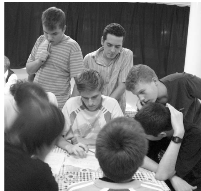
Vetélkedő a kollégiumban

– egyébként a kollégisták sport- és kézművés-foglalkozásra járhatnak, bekapcsolódhatnak a színjátszó kör munkájába, tagjai lehetnek az általában húsz-huszonkét fővel működő énekkarnak, de akár a Martinovszky István által