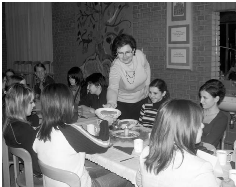
Ünnepi vacsora karácsony előtt

államosításáig. A rendszerváltást követően, 1994-ben kezdte meg újra működését az evangélikus gimnázium; új épületét 1997-ben avatták fel az evangélikus templom mellett. Az első tervek szerint a tanulók elszállásolása ezúttal a Podmaniczky-Széchenyi-kastély falai között valósult volna meg, de – amint arra