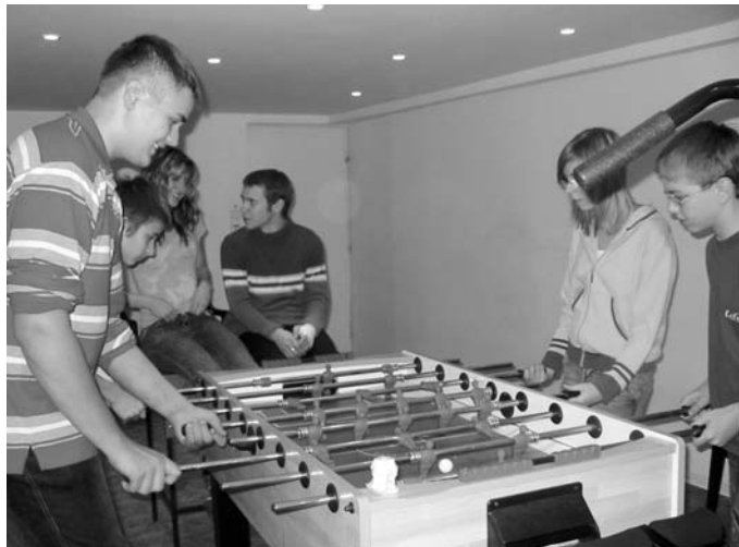
5 : 4

Bár a kollégistáknak csak a tíz százaléka evangelikus, a hétfő esti énektanuláson, illetve a szerda esti áhítaton mindenkinek kötelező részt vennie. Az áhítat szolgálatát minden héten más-más felekezet lelképásztora végzi. Az egyházi esztendő nagy ünnepeire készülve természetesen az evangelikus templom alkalmait – adventi, böjti, reformációi sorozatait – látogatják.