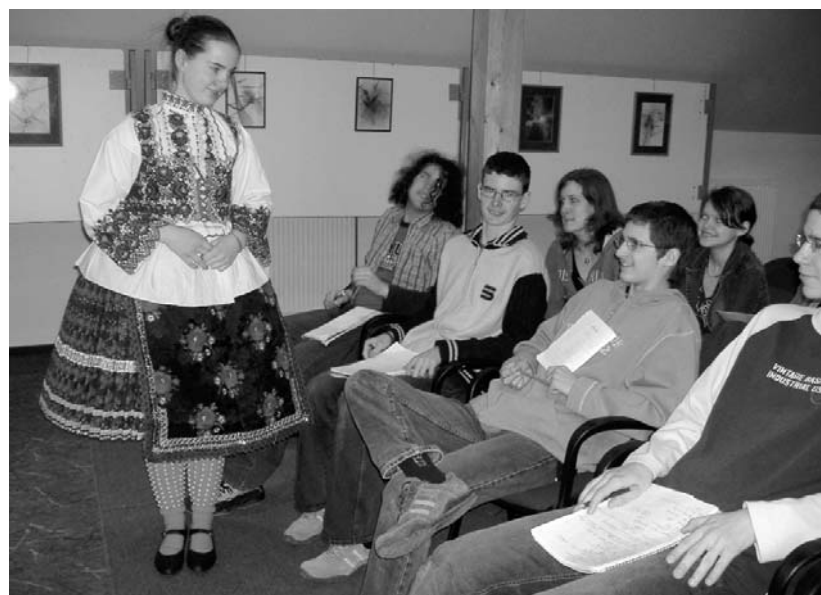
Néprajzóra élő „szemléltetőszókkal” – sióagárdi népviselet