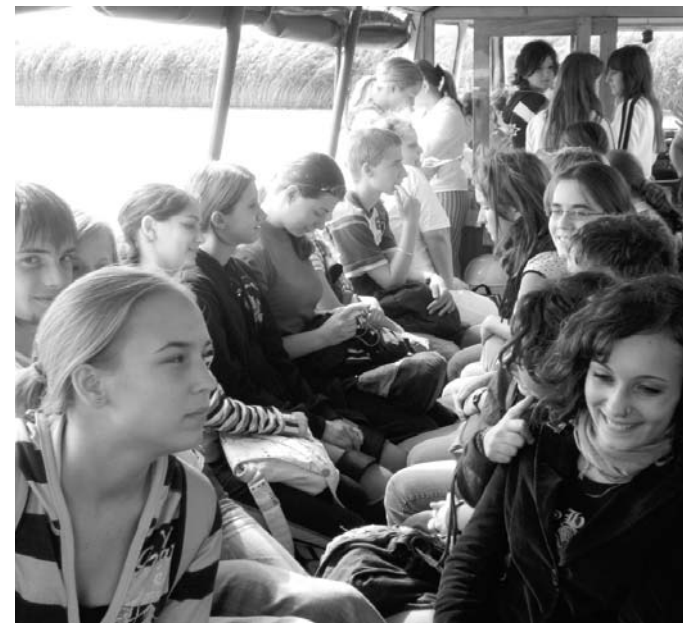
Egy hajóban eveznek – kirándulás a Velencei-tavon

A szabadon választható délutáni foglalkozások között a honismereti körtől az életmód- és a háziasszonyképző szakkörön át a különböző sportolási lehetőségekig sok minden szerepel. Az iskola jellegéből adódóan van kertész szakkör is, de például a revü, a tánc és a musical világa iránt érdeklődőknek is tudnak segíteni mozgáskultúrájuk fejlesztésében.