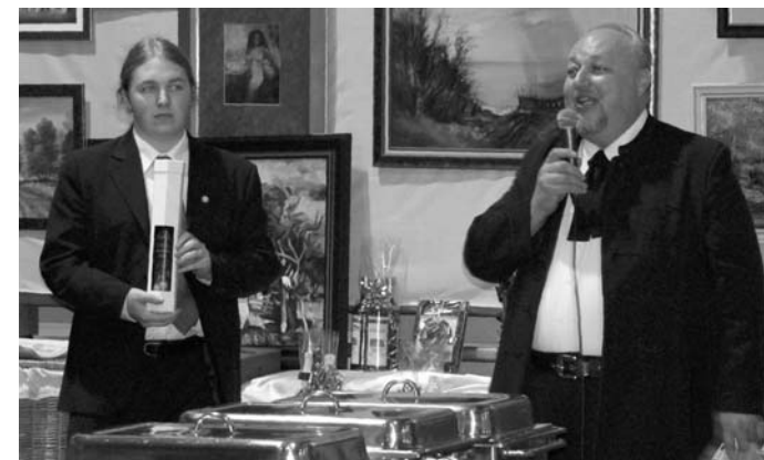
A bor- és képzőművészeti árverés

A tagság többsége katolikus felekezettől, pedig Békés tradicionálisan református település. Nem kell szégyellni, hogy leírjuk: náluk „egészségesebb” a gyülekezet korosztálybeli összetétele, vagyis több az aktív kereső, a fiatalabb, agilisebb személy, mint a legtöbb protestáns közösségben. A Keresztény Értelmiségiek Szövetsége általánosságban leginkább a római katolikus egyházhoz köthető, országos elnöke dr. Oszti Zoltán budapesti pap. A szövetségnek, mely a legnagyobb hazai keresztény civil szerveződések, hetven alapszervezete van; mintegy ötezer tag tevékenykedik bennük.