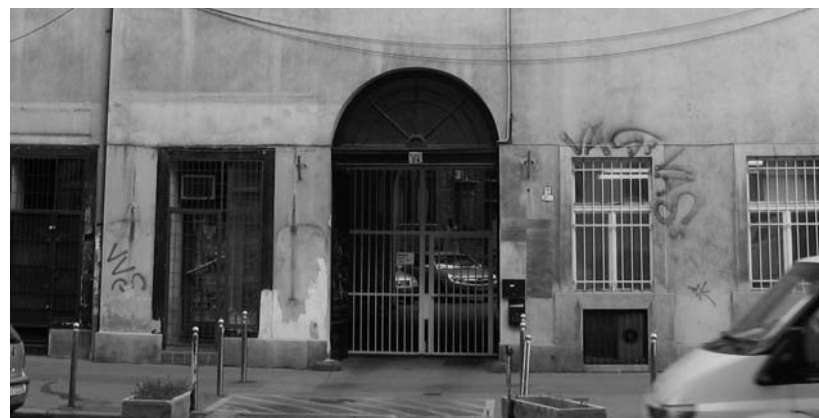
A székház bejárata

Ezen túl megoldandó az 1972-ben ideiglenesen (az akkori egyházvezetés másfél éves átmeneti időszakot tervezett) az épületbe hozott szeretetotthon helyzete. Az otthon az ideiglenes elhelyezés óta, három és fél évtizede vár végleges megoldásra. A két különböző emeleten lévő, több lakásból összenyitott szeretetotthon sem teret, sem megfelelő csendet és levegőt nem kínál idős testvéreink részére, és hosszabb távon nem működtethető az előírt és megkövetelt EU-s normák szerint.