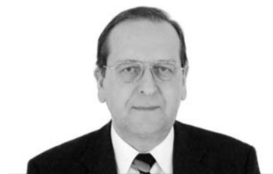
Ittész János püspök Nyugati (Dunántúli) Egyházkerület

Igazán itt az ideje, hogy végre komolyan vegyük a sokszor hallott, de igazán meg nem hallott tanácsot: gondolkodj globálisan, cselekedj lokálisan! Vagyis teintsünk a „nagy rendszer”, az egész teremtett világ folyamataira, és tegyük meg, amit a saját környezetünkben a természet védelméért, a káros hatások csökkentéséért megtehetünk. S persze gondoljunk utódainkra, és gondoljunk arra, hogy Isten az ember gondjaira bízta a teremtett világot. A kérdés kikerülhetetlen: az önző, haszonleső, embertársat és természetet kizsákmányoló ember mit tett ve-