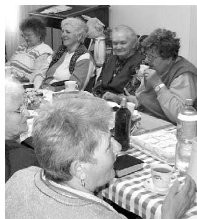
A kör tagjai a „lustanapon”

A csoport létszáma tíz éve még húsz-huszonöt fő volt, de mára már legfeljebb nyolc-tíz asszony jön össze. A tagok odafigyelnek egymásra, megbeszélnek