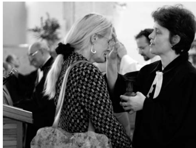
A következő Tamás-mise szeptember 16-án 15.30-tól lesz, a városszéki keretében szabadtéren, a Deák téri templom háta mögötti Városháza parkban.