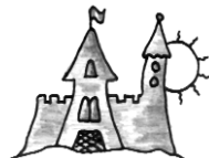
Rovatgazda: Boda Zsuzsa