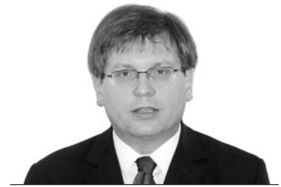
Fabiny Tamás püspök Északi Egyházkerület

Mielőtt gondolatai és érzései teljességgel összekuszálódnának, elővonná régi, tizenkilenc éve érintetlen Bibliáját, és fellapozná Péter apostol második levelének e szakaszát: „...az Úr előtt egy nap annyi, mint ezer esztendő, és ezer esztendő annyi, mint egy nap.” (2Pt 3,8) Ettől aztán végre megnyugodna, és több derűvel szemlélné ezt a furcsa, összekuszált világot.