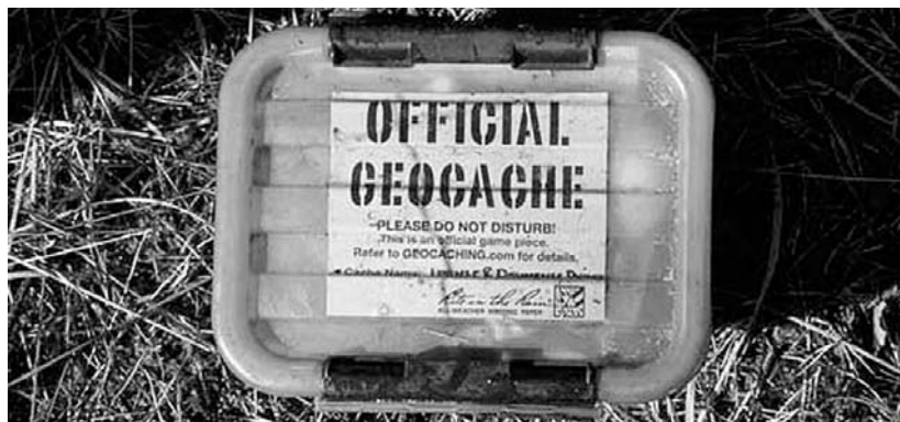
Egy „nagyon hivatalos” geoláda Hollandiában

Ha megtaláltad a keresett pontot, akkor már csak két dolgod van: jegyezd meg a jelszót, és nézzél alaposan körbe – akár a tahi híd közepén állsz, akár a Tolna megyei Murga határán! Otthon aztán irány az internet, hogy bejegyezhesd: újabb geoláda (az elrejtett, jelszót tartal-