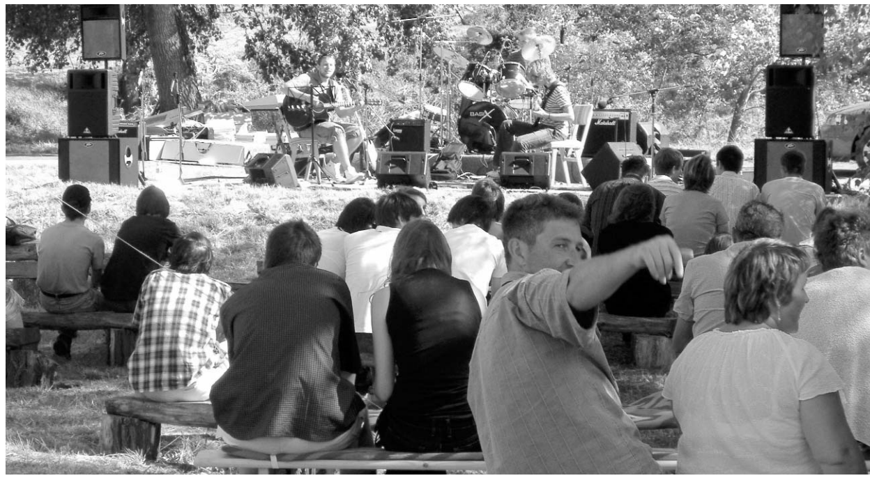
A Jesus Buff koncertje