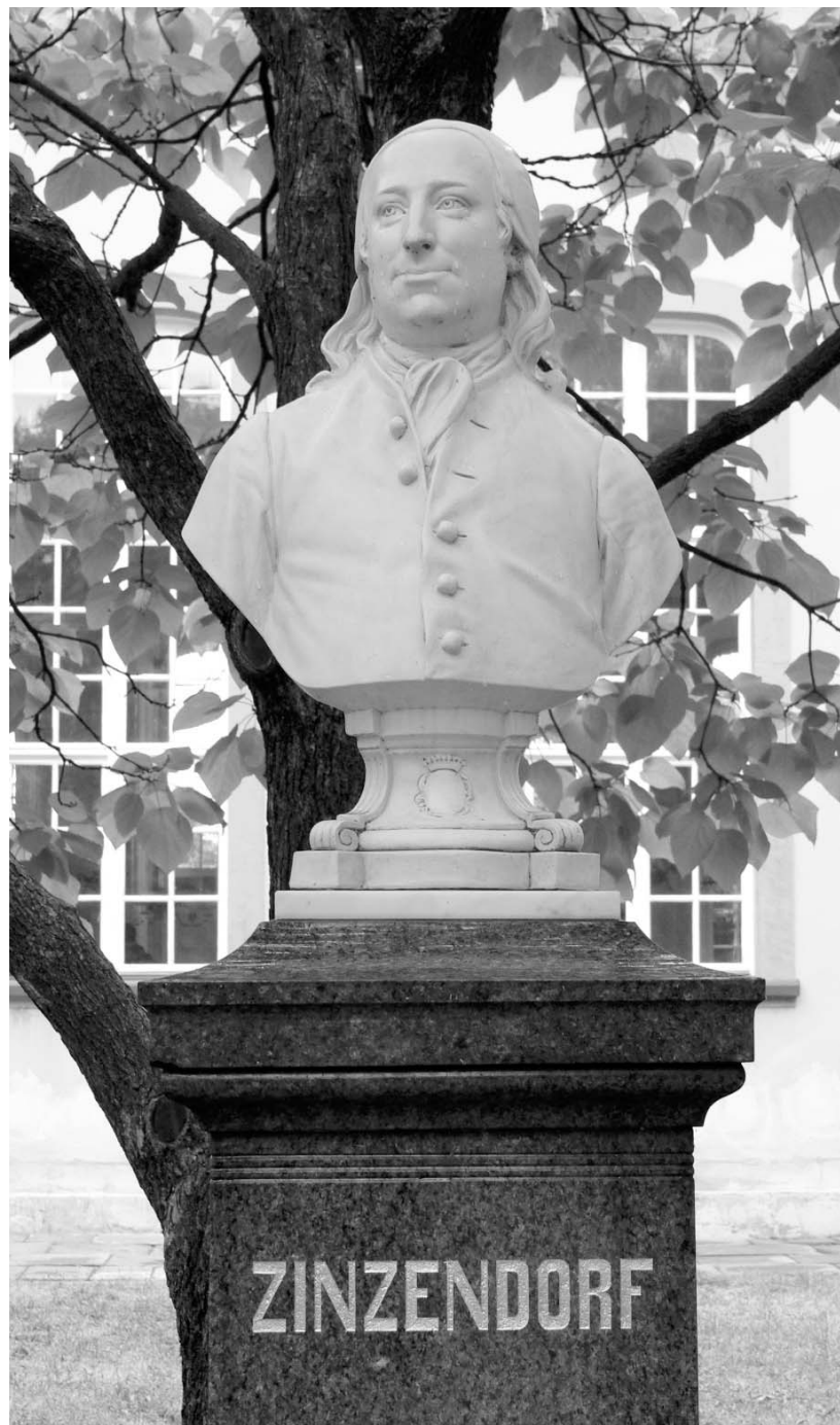
Zinzendorf szobra Herrnhutban. A gróf munkabírása rendkívüli volt: száznál több könyvet és mintegy kétezer vallásos éneket írt.

lát működtetnek, például pár éve kezdte meg működését egy gimnázium Herrnhutban, noha a településen alig több mint ezren élnek. Ennek anyagi hátterét jelentős részben amerikai közösségek biztosítják. Az iskolában kötelezően tanítják a cseh nyelvet, ezzel is emlékeztetve a cseh–morva ősekre. Pedagógiai prog-