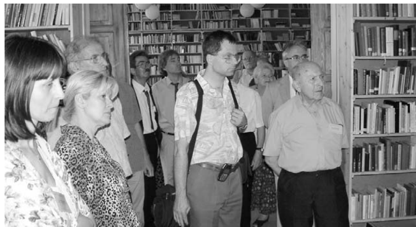
A konferencia résztvevői a fásori gimnázium könyvtárában

A konferencia résztvevői – levéltárosok, történészek és egyháziak – aktuálisabb témát talán nem is választhattak volna. A 19–20. századi liberalizmus és szekularizáció következtében az egyházak szerepe háttérbe szorult. Elsőrendűen fontos munkaterületté vált az egyházak számára a kapitalista fejlődés során a társadalom szélére szorultak, a betegek, gyengék, árvák, elesettek, esetleg üldözöttek támogatása, védelme.