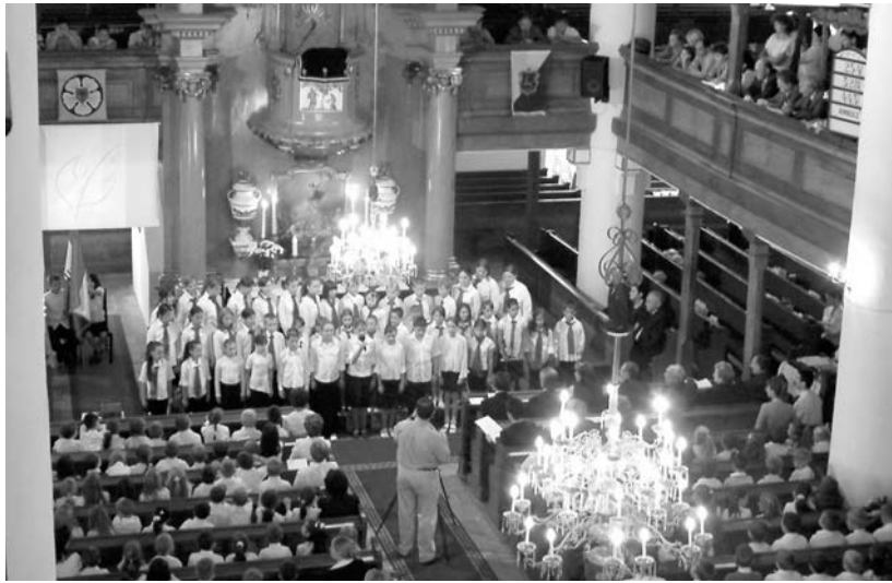
A Benka Gyula Evangélikus Általános Iskola és Óvoda tanévnyitója a szarvasi Ótemplomban

► Tanévnyitóról és iskolalelkész-iktatásokról összeállításunk a 6–7. oldalon