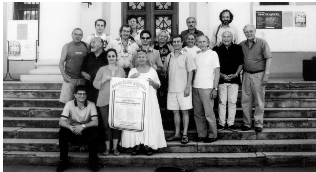
Az Evangélium Színház társulata Székelyudvarhelyen

– A Weiner Leó által jegyzett eredeti zenei kíséretet elhagytam, és a Kaláka együttes egyik tagját, Huzella Pétert kértem meg arra, hogy írjon zenét a darabhoz, és amolyan mai krónikásként gitárkísérettel színesítse az előadást. A fiatal szerelmesek szerepére ifjú, a Színház- és Film-művészeti Egyetemen most végzett, te-