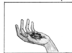
5 – Pörkölt gabona