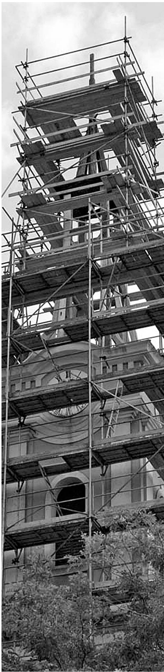
KÉPUNK ILLUSZTRÁCIÓ