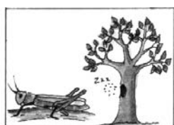
1 – Sáska, erdei méz