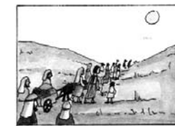
D – A pusztaságban vándorló nép