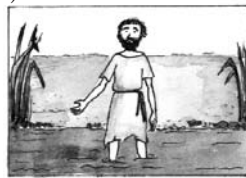
C – Keresztelő János