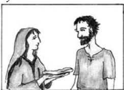
E – Illés és a sareptai öregasszony