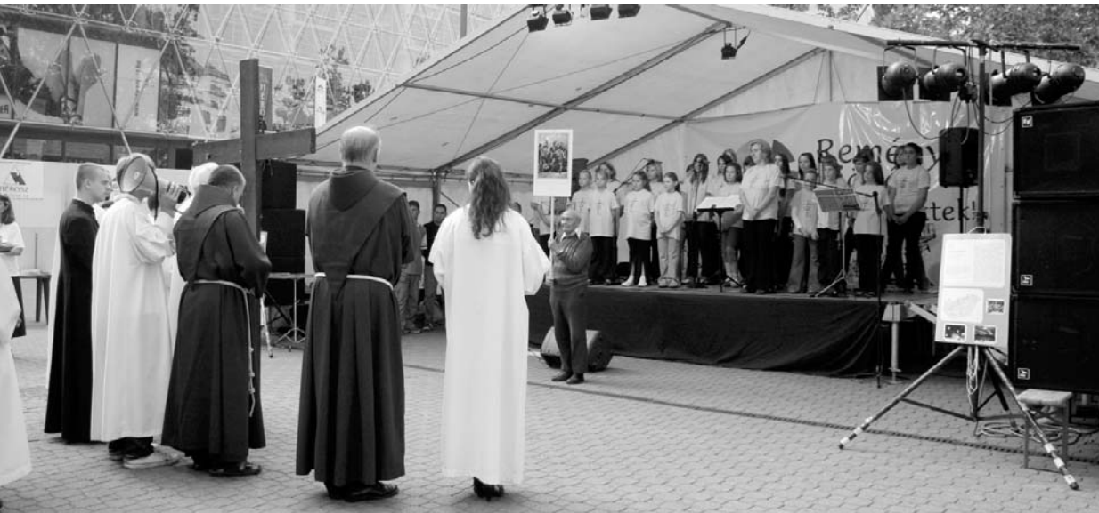
Felkezetek találkozója a budapesti Vörösmarty téren – katolikus körmenet résztvevői a fellépésre készülő evangélikus énekegyüttes, a pilisi Izsópka színpada előtt

► Beszámoló a rendezvénysorozathoz kapcsolódó Tamás-miséről a 4. oldalon