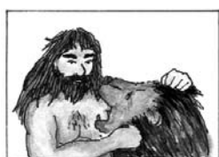
B – Sámson