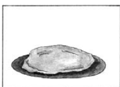
2 – Lepény