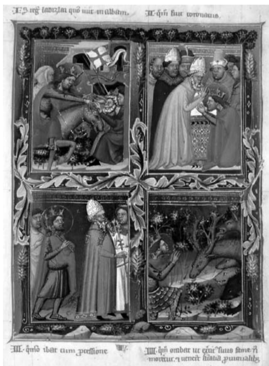
Szent László életét bemutató képek a Magyar Anjou Legendáriumból

A jelöltnek tulajdonított, halála előtti csodák alapján boldoggá is avathatják a szóban forgó személyt. Ez jelenleg megelőzi a szentté avatást, és két úton történhet. Ha az illető nem részesült nyilvános tiszteletben, akkor szabályszerűen kell felolvasni a pert előbb egyházmegyeyi szinten, majd továbbítani az ügyet az illetékes kongregációhoz. Ha azonban a nyilvános tisztelet igazolhatóan fennáll, per nélkül kérhető a pápa pozitív megerősítése. Az első esetben két csodát, a másodikban hármat kell hitelesíteni, a kánoni előírásoknak megfelelően igazolni. Az illető személy „közbenjárásának” tulajdonított csodákat is vizsgálat tárgyává teszik. Miután az illető további csodatételeit is igazolni lehet, a pápa végső döntést hozhat a boldoggá vagy szentté avatásról.