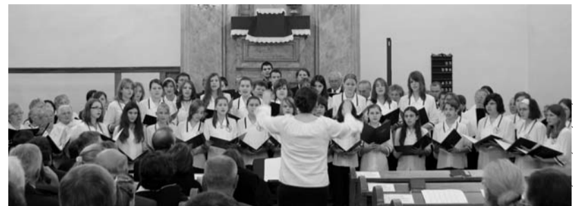
Az aszódai evangélikus gimnázium és a vanyarci gyülekezet közös kórusa – idősek és fiatalok együtt

Több éve összehoztak nagyobb kórusok és számypróbálgató kisebb együttesek énekeltek Crüger- és Bach-korárfeldolgozásokat, spirituálékat, régi evangélicizációs énekeket, Kodály-dallamot és különböző kórusműveket. (A kórustagok színes sálakkal jelezték összetartozásukat, némelyek azonban – mivel több énekkarban is szerepeltek – váltogatni voltak „kénytelenek” őket.) Hallhattunk „háromgenerációs kórusokat” is énekelni, és több lelkész, illetőleg lelkészfeleség is énekkari tagként vonult az oltár elé. Az egyik lelkészcsaládnak hét tagja is énekel az est folyamán.