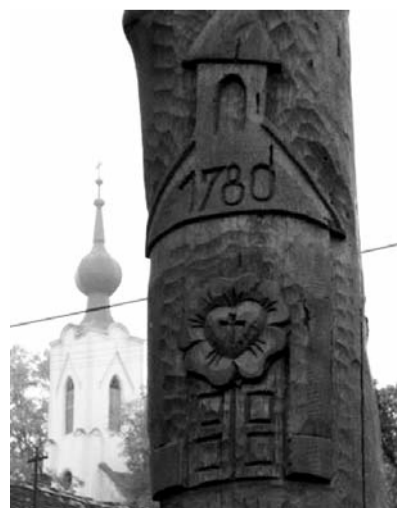
„Evangélikus életfa” Ágon

Az életfa igen ősi motívum. Számos nép, így a nyugati germánok, az egyiptomiak és különösen a sztyeppei népek mitológiájában is szerepel; meghatározza az istenek, a földi ember és az alvilág viszonyrendszerét. A Biblia is többször említi. A magyarok istenfának ismerték; a Krisztus Urunkat megelőző időkben a mindennapok része volt.