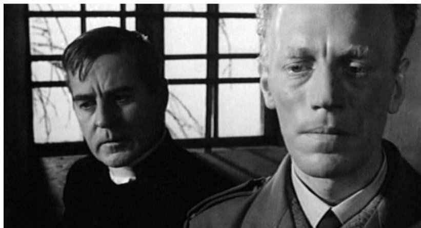
Jelenet az Úrvacsora című filmből

Mély levegőt kell vennie annak, aki három napon át délutántól éjszakáig Bergman-mozizásra szánja rá magát, mert nem a Született feleségek harmadik évada a kérdéses mű, nem könnyedén magával ragadó szórakozás, amit válasszunk. De mikor máskor vettünk volna mély levegőt, ha nem éppen most, az alkotót búcsúztatva?