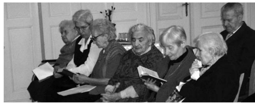
Az otthon mai lakóinak egy csoportja