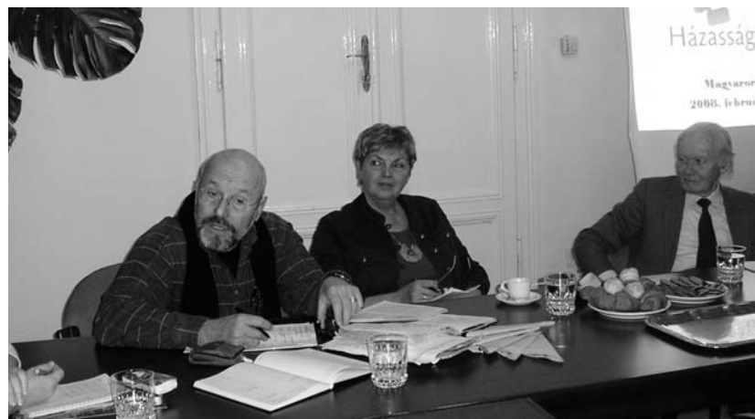
Balról jobbra: Levente Péter, Döbrentey Ildikó és Pálhegyi Ferenc