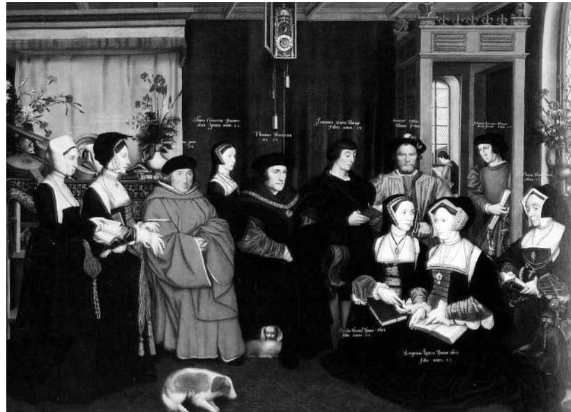
Morus Tamás családja körében – Hans Holbein festménye

A Pázmány Péter Katolikus Egyetemen Kora-Tudor hitviták címen az Országos Tudományos Kutatási Alap (OTKA) által támogatott kutatás folyik, melynek vezetője e sorok szerzője. A