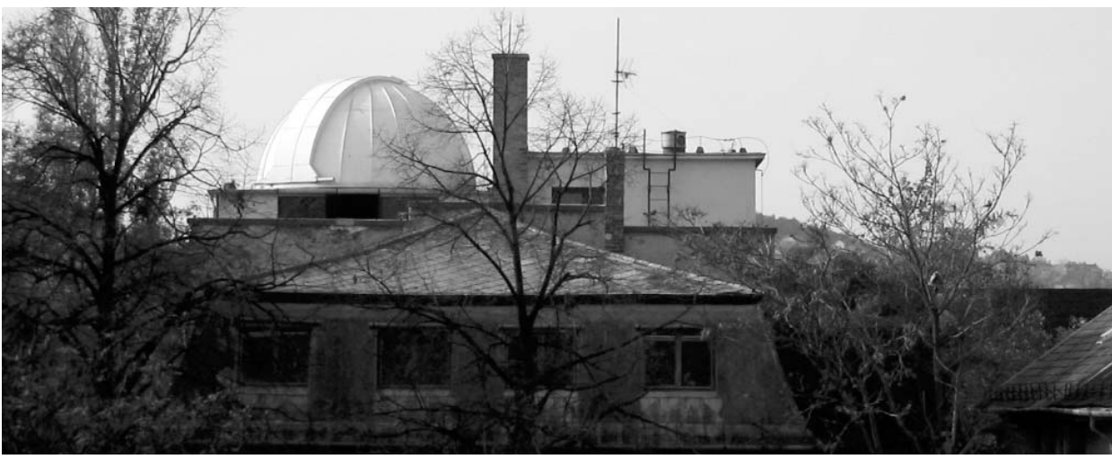
A csillagvizsgáló kupolája 2004-ben