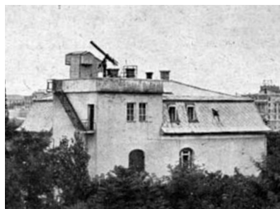
Az Uránia Csillagvizsgáló 1951-ben

csillagvizsgáló intézet használatába adta az épület helyiségeit, hogy az egyesülettel közösen bemutató csillagvizsgáló céljaira használja őket; az intézet pedig átadta a felesleges és használaton kívüli műszereit, valamint könyvtára másodpéldányainak egy részét az egyesületnek. Mivel azonban az állami csillagvizsgálónak nem állt módjában bemutató-