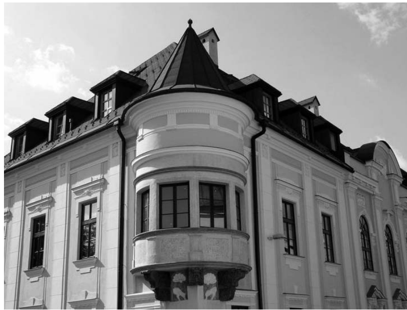
A hajdani vármegyeháza Besztercebányán

A Kárpát-medencében sok egyházi könyvtár hasonló gondokkal küzdött a második világháború után: vagy megszüntették őket, és anyagukat szétszórta, vagy anyagi nehézségek miatt nem fejlődhetek. A rendszerváltozás óta mindenhol megindult a fejlődés. Példa-