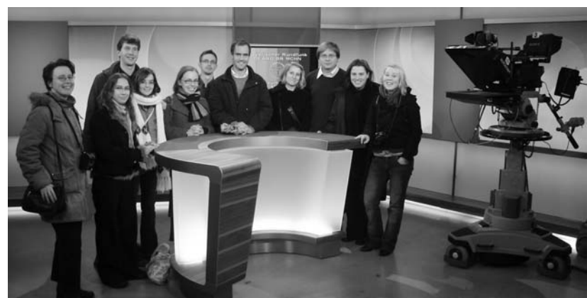
Próbafelvétel a résztvevők egy csoportja

Egy másik fontos impulzust jelentett a Bayerischer Rundfunknál – a bajor médiaközpontnál – tett látogatás, ahol Rüdiger Baumann televíziós műsorvezető és szerkesztő a jó kapcsolatok fontosságát a következő példával illusztrálta: „Amikor egy bevásárlóközpontban kell fil-