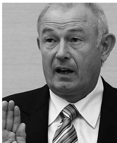
Günther Beckstein bajor miniszterelnök

Belügyminiszterként a zsinat aktív tagja volt, aki hivatali kötelességeit is úgy rangsorolta, hogy mindig részt vehessen az üléseken, a munkabizottságokban. Magam is több ülésen találkoztam vele a korábbi években. Közvetlen, kedves ember volt, aki sajátjának érezte egyháza örömeit és gondjait, véleménye volt, és véleményt formált hozzászólásaiban. Szünetekben a folyosón megszólítható volt, magas pozíciója ellenére természetesen mozgott zsinati tagtársai között.