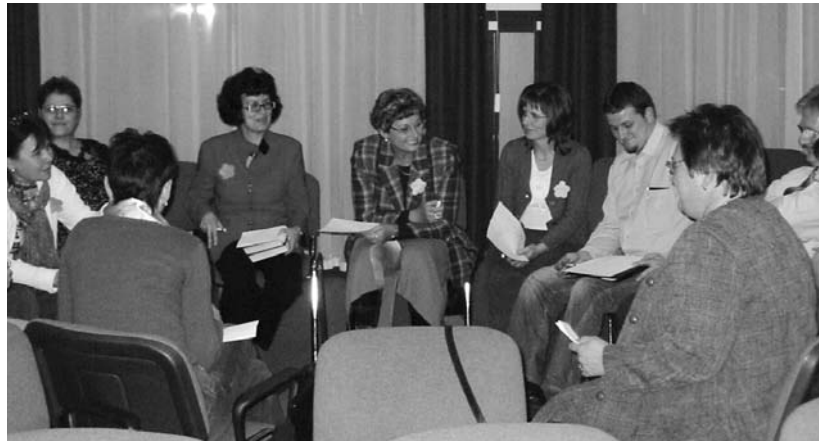
A csoportfoglalkozás egyik pillanata