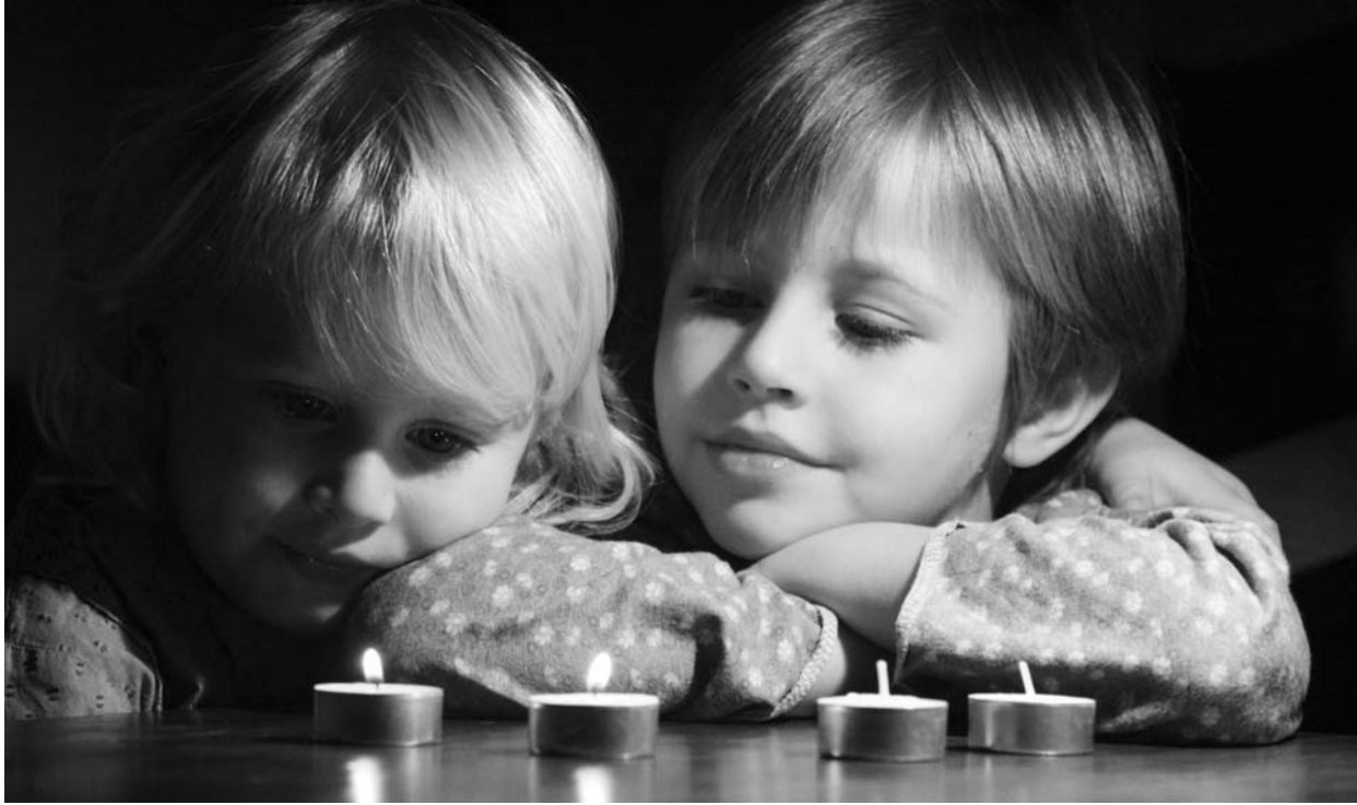
A szerkesztőségünk által kiírt, Adventi gyertyák című fotópályázat második kategóriájának győztes felvétele