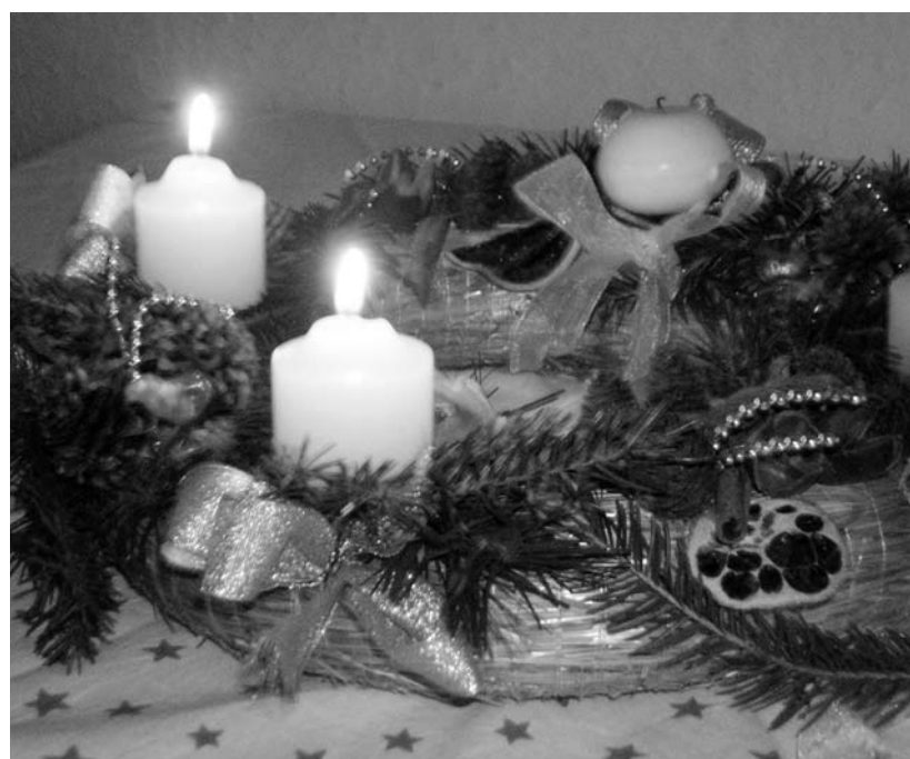
Adventi gyertyák – a kép fotópályázatunkra érkezett