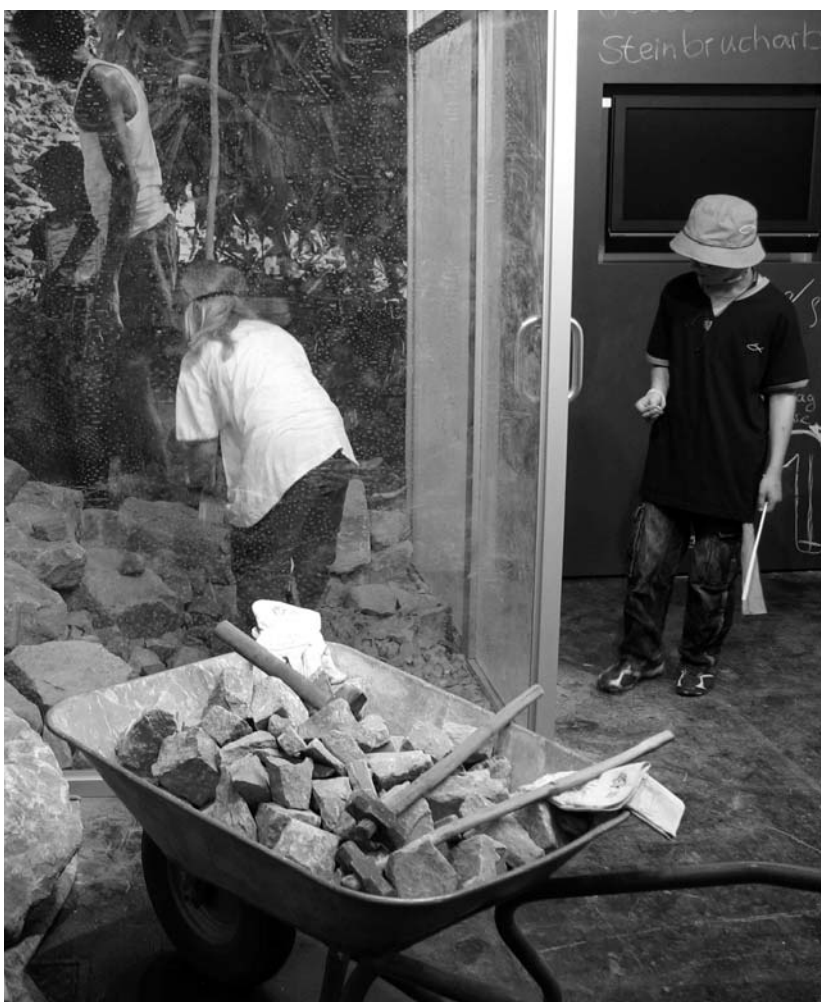
Az idén júniusban Kölnben megrendezett német evangélikus egyházi napokon, a Kirchentagon csak játék volt az, ami a világ számos más pontján maga a valóság. A rendezvényre ellátogatott gyerekek kipróbálhatták, milyen a szerencsétlenebb sorsú – tanulás helyett mindennapi robotra kényszerített – kortársaik által végzett nehéz fizikai munka. Felvételünkön egy fiúcska épp a köfejtéssel ismerkedik.