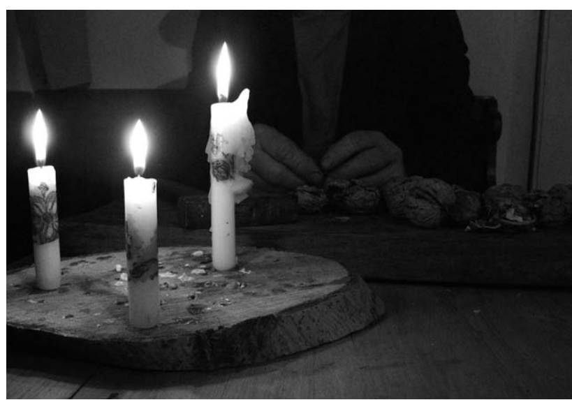
Adventi gyertyák – a kép fotópályázatunkra érkezett