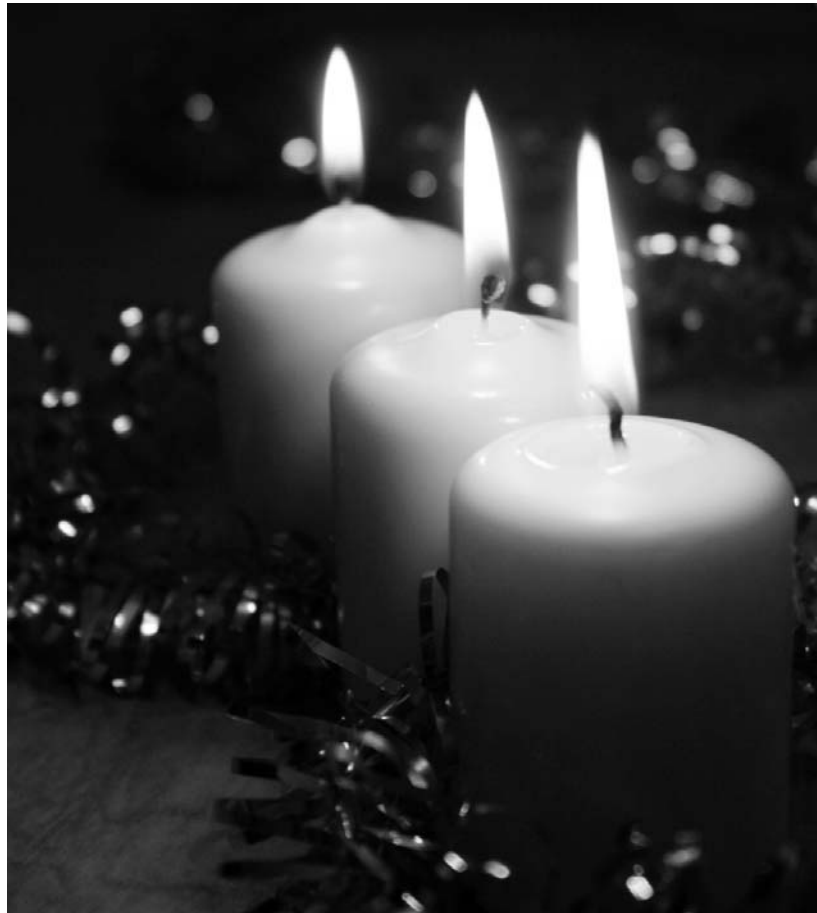
A szerkesztőségünk által kiírt, Adventi gyertyák című fotópályázat harmadik kategóriájának győztes felvétele

▶ Luther Márton: Tizennégy vigasztaló kép megfáradtaknak és megerhelteknek (Virág Jenő fordítása)