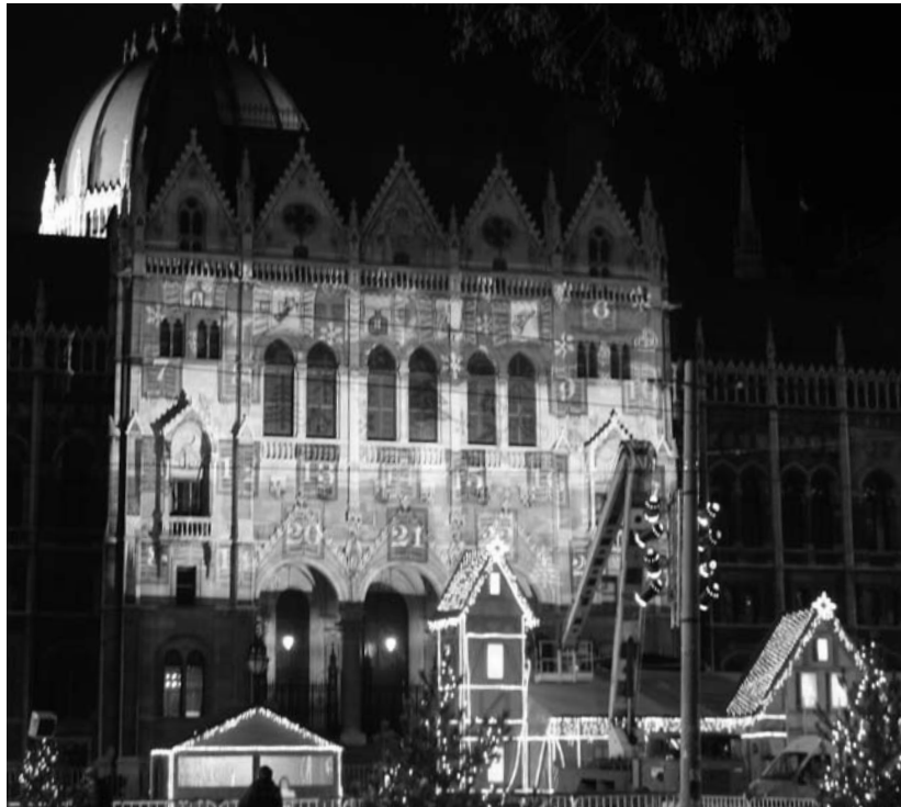
Estéknként adventi kalendáriummá alakul a Parlament: sötétedéskor színes fényjáték vetül az épület Kossuth téri homlokzatára. Szentestéig minden délután kinyílik egy virtuális ablak, amely mögött karácsonyi motívumok láthatók.

► Vajon az adventi koszorú korunkban csak a családi asztalra, a templomokba való? A betlehemezés már csak múzeumi foglalkozások vagy iskolai ünnepek karácsony táján „kötelező programpontja”? Esetleg kiváló alkalom gyülekezeteink lelkészei és tagjai számára arra, hogy településük főterén megszólják az embereket, és megosszák velük adventi üzenetét? Hazánk jó néhány községében-városában a helyi evangélikus közösség aktív résztvevője az ott élők közös adventi készülődésének. Az alábbiakban ilyenekről igyekszünk – korántsem teljes – körképet nyújtani olvasóinknak.