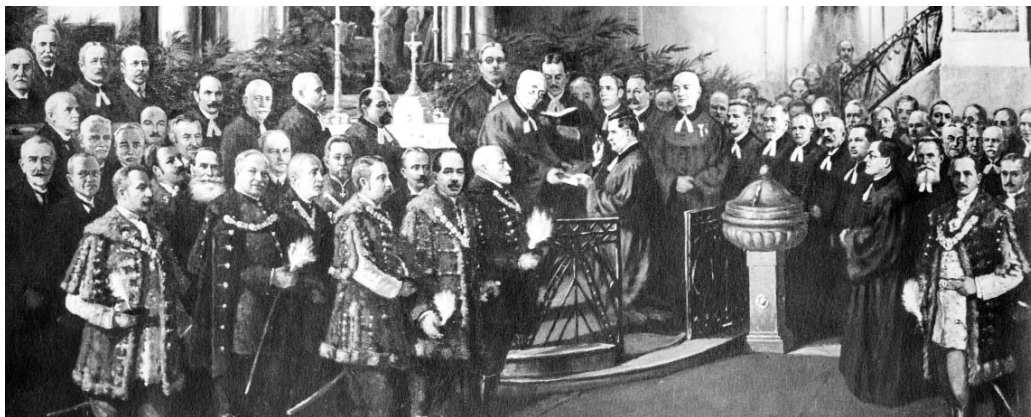
Raffay Sándor bányakerületi püspök iktatási istentisztelete – a történelmi Magyarország utolsó püspökiktatása – a Deák téri templomban 1918. szeptember 15-én

Az evangélikus egyházigazgatás szempontjából az 1894-es budapesti zsinat jelentős változásokat hozott: a szlovák nemzetiségi törekvések visszazsorítása érdekében mesterségesen átszabta a kerülethatárokat. A zsinat az addig szlovák többségű dunáninneni kerülethez csatolta a bányai kerületből Nógrádot, Hontot és Barsot, a dunántúli kerületből pedig Fejér-Komáromot. Az 1894-es reformmal a dunán-