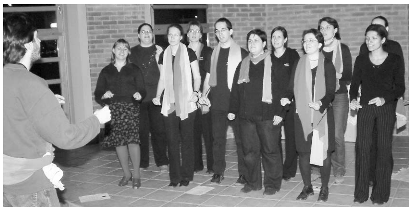
A rendezvénysorozat keretében az egyetemi gyülekezet gospelkórusa, az Égőgérő is önálló műsort adott