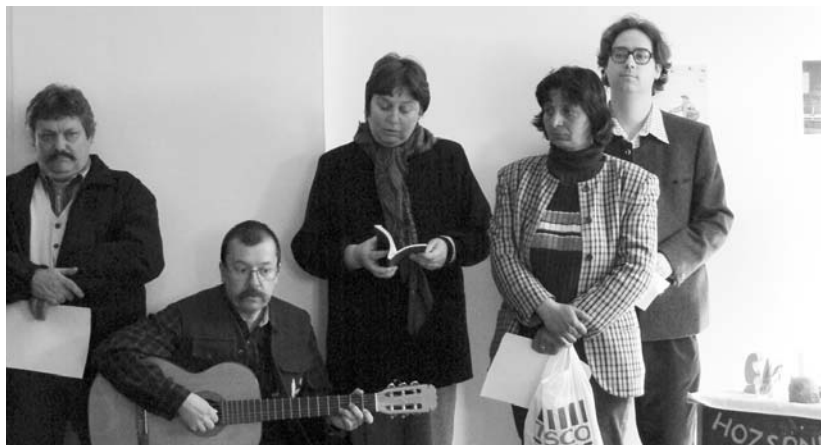
A ház felújítását nem kívülről, hanem belülről kezdték el