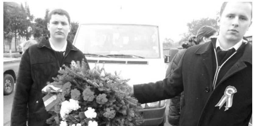
A nyíregyházi gimnázium tanulói a március 15-ei székykeresztúri ünnepségen

részt az ünnepségen. Itt találkoztunk az unitárius egyházzal, a város és a városi intézmények vezetőivel. Diákjaink félórás, igényes kulturális műsorral készültek – ugyancsak második alkalommal –, melynek keretében énekeltek, verset mondtak, illetve szemelvényeket olvastak fel irodalmi művekből, mindezt pedig a korra jellemző képekkel színesítették. Ezután az ünnepelő serege fúvószenekar kíséretében a város főterére vonult. Számtalan magyar zászlót lengetett a szél, és mindenki kokárdát viselt... Rend-