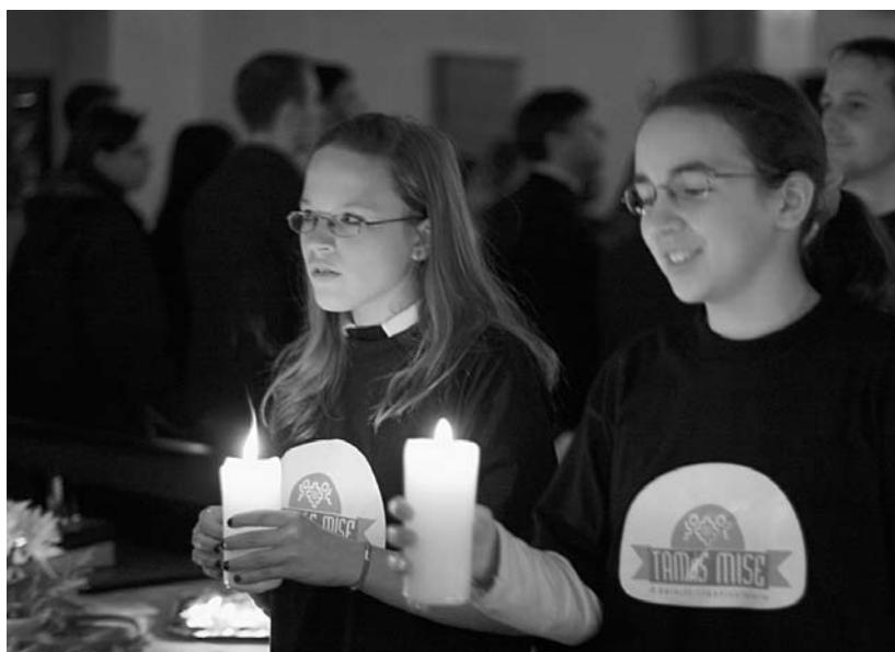
TODOROFF LAZÁR FELVÉTELEI