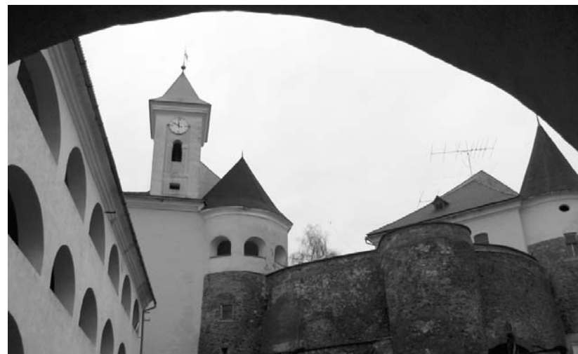
A munkácsi vár