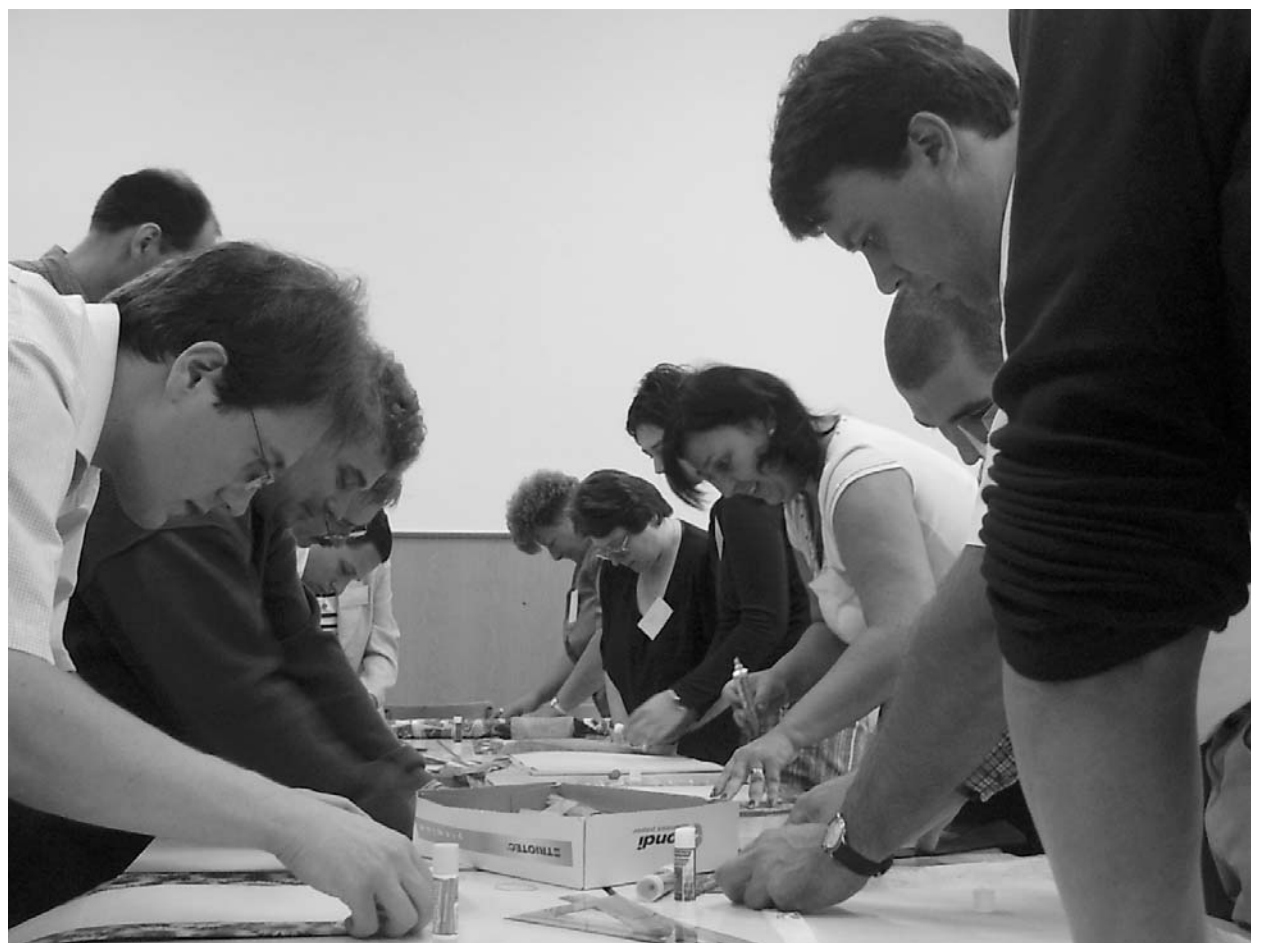
A képzők képzése