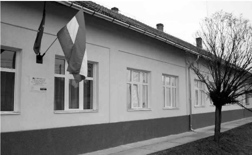
A népfőiskola épülete

A francia partner szakképzéssel kombinált szociális vállalkozásának társadalmi kisebbségek körében megszerzett tapasztalataiból kitűzhetjük azt az irányt, mely sem a hazai partnerség egyes tagjaitól, sem magától az evangélikus egyháztól nem áll távol: ha az embereknek lelki és szellemi segítség mellett közösségi teret is adunk, akkor képesek lehetnek arra, hogy új módon lássák az élet helyzetüket, és együtt lesznek képesek megoldani a nehézségeiket.