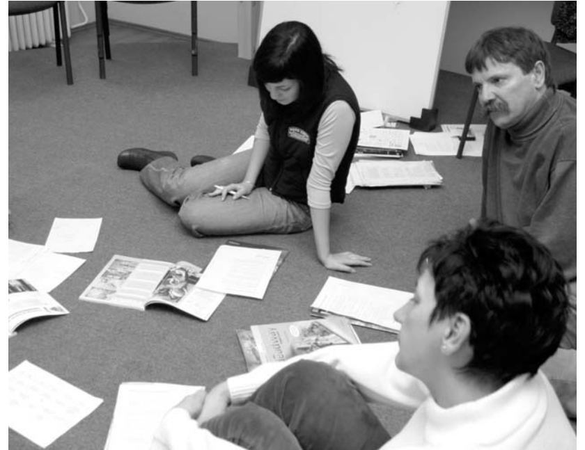
Angolóra – egy kicsit másként