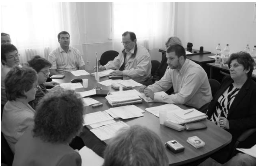
A fejlesztési partnerség ülése