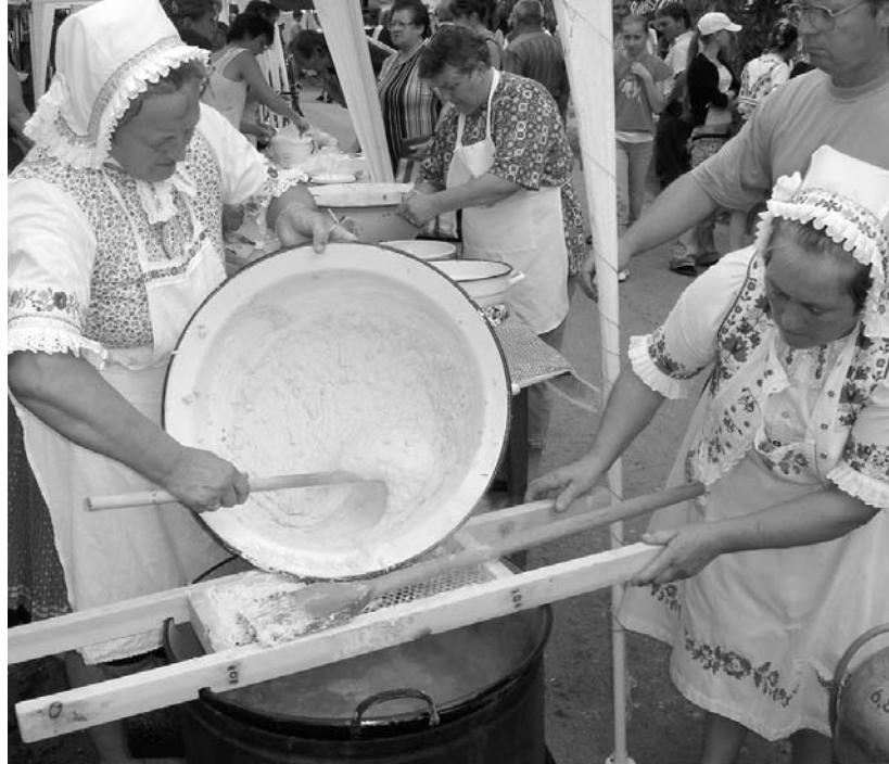
Rotyognak az üstök Tótkomlóson...

▶ Luther Márton: Tizenegyet vigasztaló kép megfáradtaknak és megterhelteknek (Virág Jenő fordítása)