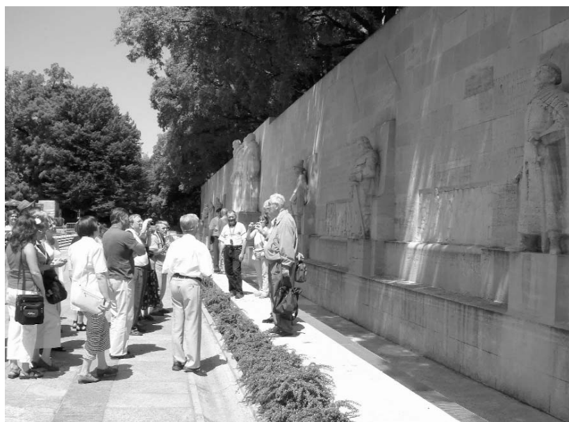
A reformáció emlékműve előtt