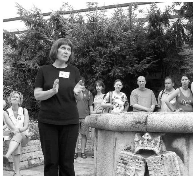
Kerti séta a budai Várban

tözet. Egy reneszánsz női ruhában vígan ki lehetett hordani egy gyereket úgy, hogy arról legfeljebb csak a rosszmaájuk sejtettek valamit. Furcsa volt látni, ahogy a strandpapucsos lányok egy pillanat alatt méltóságtejes hölgyekké váltak a királyi ruhákban. A fiúk kevésbé gyorsan változtak át gazdag firenzei polgárokká. Vannak ruhák, amelyeket tudni kell viselni... Nyilvánvaló, hogy ebben az öltözékben csak