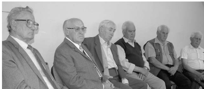
Soltvadkerti volt munkaszolgálatosok a művelődési házban tartott összejövetelen

„Mi legyen a kulákcsemetékkel, a grófi sarjakkal, a szektákkal és a többi, ellenséges elem fiaival a hadseregben?” – ez a kérdés volt napirenden 1950 júniusában a Honvédelmi Minisztérium illetékes bizottságában. Az egyik szovjet tanácsadó, Szergejev vezérőrnagy azt a véleményt támogatta, mely szerint „ezeket a