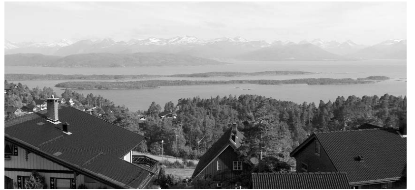
Látkép a teraszról

volna fogadókészség egy magyar testvérgyülekezeti kapcsolatra. Megosztva elképzeléseimet D. Szabik Imre püspökkel, még nagyobb gondoltunk. Egyházkerületi kapcsolat illene! Egyre merészebben gondolkodtunk, és hamarosan jött is a hír, hogy a Møre és Romsdal püspökség – egy a tizenegy norvég egyházkerületből – Odd Bondevik püspök vezetésével szívesen fogadja közeledésünket.