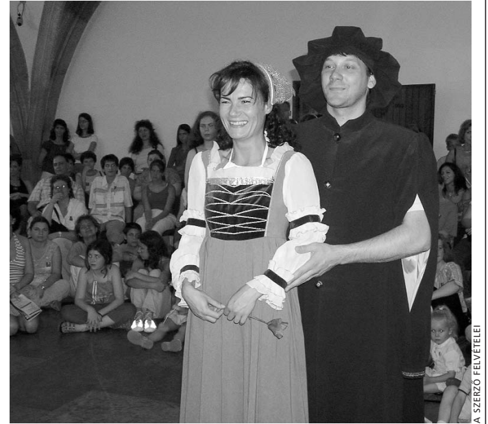
Reneszánsz ruhapróba a gótikus boltívek alatt

A régi Buda erkölce című tárlatvezetésén további furcsaságok derültek ki jeles királyaink viselt dolgairól. Például amikor Károly Róbertet megkoronázták 1309-ben, a koronázási eskübe bele kellett foglalni azt is, hogy megígéri: csak egy felesége lesz. Derék eleink addigra már rájöt-