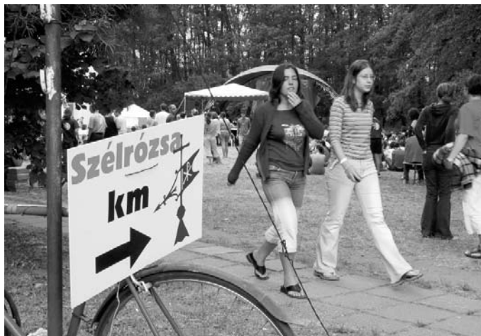
BARTA INRE FELVÉTELE A 2004-ES SZÉLRÓZSÁN KÉSZÜLT