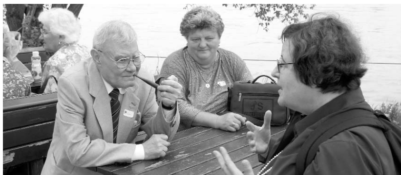
KEPUNK ILLUSZTRÁCIÓ

Szükségünk van a szünetre, erre a küzdelmes félidek közötti, nyugalmasabb időszakra. Ahogyan ezt megtapasztaltuk az év talán legtöbb embert összefogó, egységesítő eseményének, a futball-világbajnokságnak néhány sorsdöntő mérkőzésén is. A pár perces leállás kijavíthat még szarvashibákat is. A külső szemlélő a szünetben mondhatja el észrevételeit, a belülről aligha érzékelhető hiányosságokat. A tribünön a nézők, akik eddig idegenek voltak, a szünetben már úgy közelednek egymáshoz, mint ha régi ismerősök volnának. A szakemberek gyors helyzetértékelése lelket önthet a második félide a játékosokba. Maguk a küzdők pedig tetőtől talpig felfrissülhetnek, ha engedik, hogy szakemberek vegyék gondozásba őket.