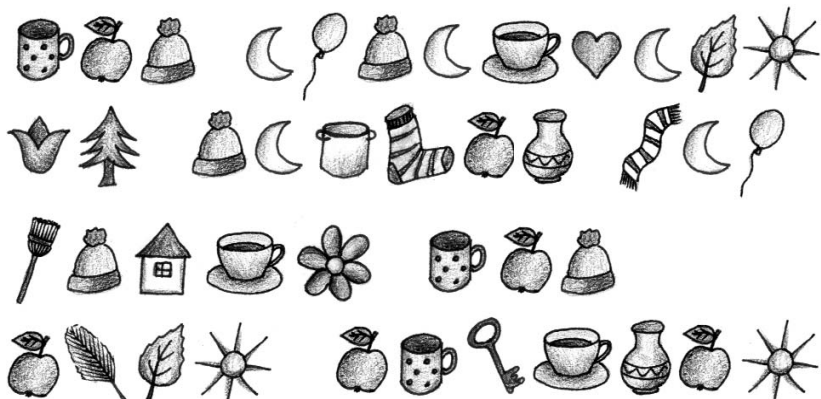
RAJZ: JENES KATALIN