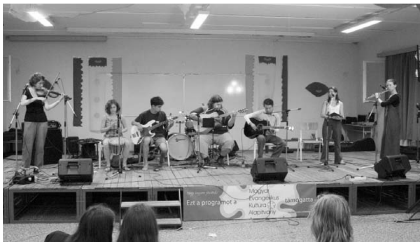
Színpadon a Felsővezeték