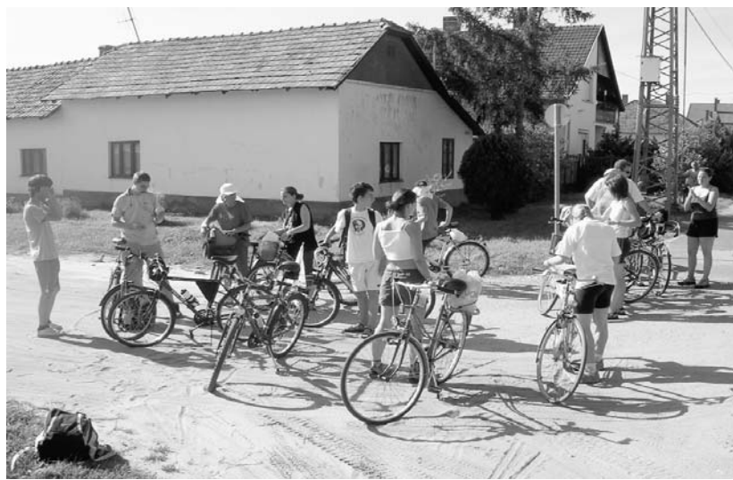
A SZÉLRÓZSA TALÁLKOZÓ FELVÉTELEI