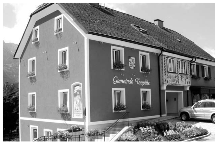
Rathaus – Tauplitz