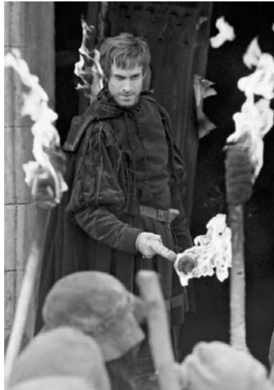
A reformáció emlékezete Eric Till Luther-filmjében