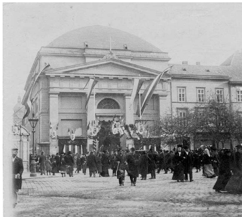
A Deák téri gyászistentisztelet 1906. október 28-án

A Deák téri gyászszertartásnak katolikus és református résztvevői is voltak, így többek között Fraknoi Vilmos római katolikus és Baksay Sándor református püspök. Thököly ravatala mellett az istentisztelet után délután 4 óráig óránként országos képviselők álltak díszőrséget. A tengernyi koszorú között – egykorú feljegyzések szerint – ott volt a Pesti Magyar Egyháznak, a rákoskeresztúri, a bakkonyorsóhelyi gyülekezetnek, Józsefvárosnak és – Zrínyi Ilona tiszteletére – az Országos Nőképző Egyesületnek a koszorúja is.