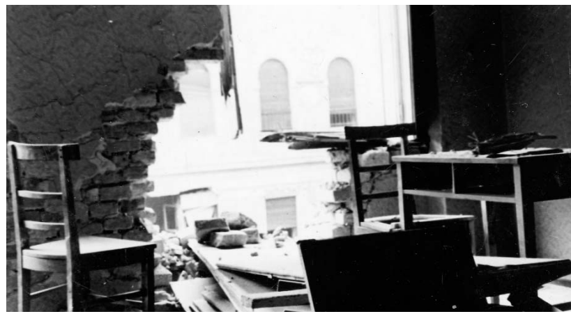
Szovjet tanklövődék szakította át az egyik teológusszoba falát