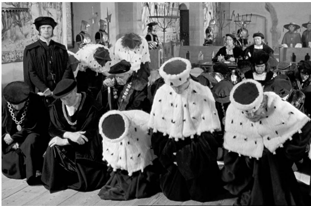
AZ ÁGOSTAI HITVALLÁS ÁTNYÚJTÁSA – JELENFOTÓ ERIC TILL LUTHER-FILMHEŐL

Császári Felséged a választófejedelmeknek, fejedelmeknek és birodalmi rendeknek nem egyszer, hanem ismételten azt is kegyesen tudtára adta, az Úr 1526. esztendejében Speyerben tartott birodalmi gyűlésen pedig császári üzenetének megadott és előírt formájában nyilvánosan felolvastatta, hogy Császári Felséged bizonyos, akkor megjelölt okoknál fogva ebben a vallási vitában nem kíván döntést hozni, ellenben a római pápánál szorgalmazni szándékozik a zsinat összehívását. Ez még részlete-