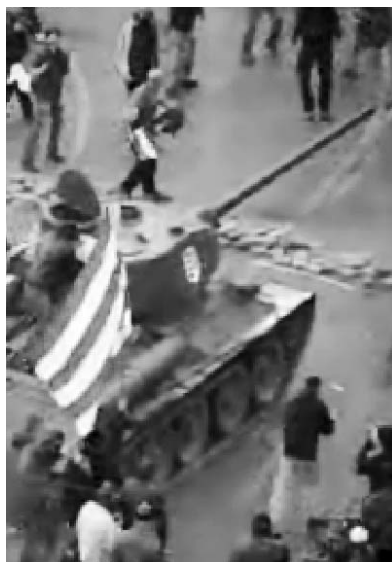
1956 emlékezete Budapesten 2006. október 23-án