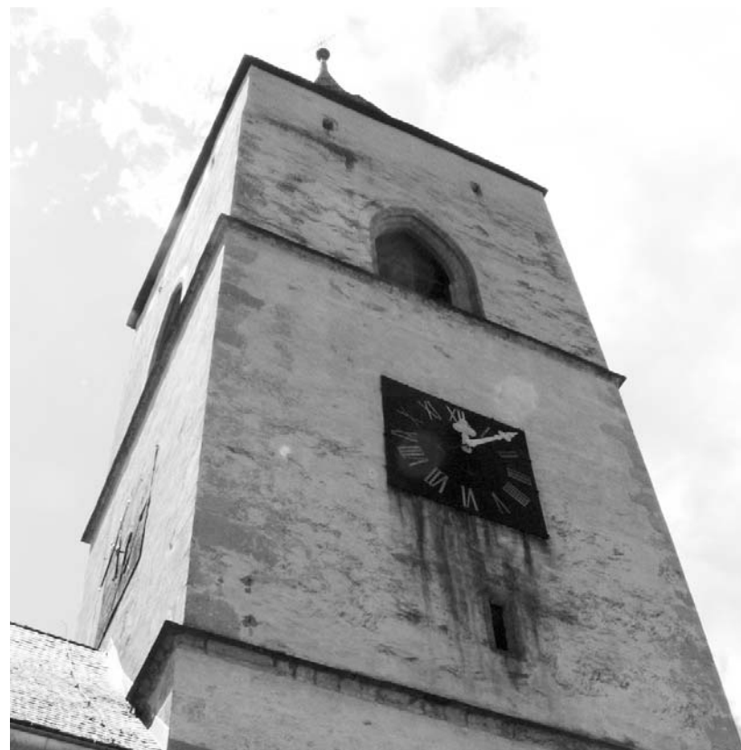
Kirchturm von Pürgg

Im 1752 wurden auf Befehl Maria Theresias und nach einem langen Schriftverkehr die ersten Deportationen nach Siebenbürgen und Ungarn durchgeführt.