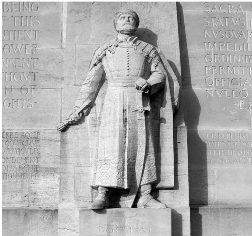
Genfben, a reformáció emlékművén Bocskai szobrán a fejedelem jelmondata latinul. Magyarul a felirat: „Hitünknek, lelkiismeretünknek és régi törvényeinknek szabadságát minden aranynál feljebb becsüljük.”

Hosszas alkudozások után – a fejedelem közbenjárására – Bécs a nemeseknek, a városoknak és a végvárak katonáinak az egész ország területén megengedte, hogy tetszésük szerinti vallást kövessenek. Bocskai István ezzel hosszú időre biztosította nemcsak Erdély függetlenségét, hanem az összes magyar protestáns vallásszabadságát is. 1606 nyara volt ek-