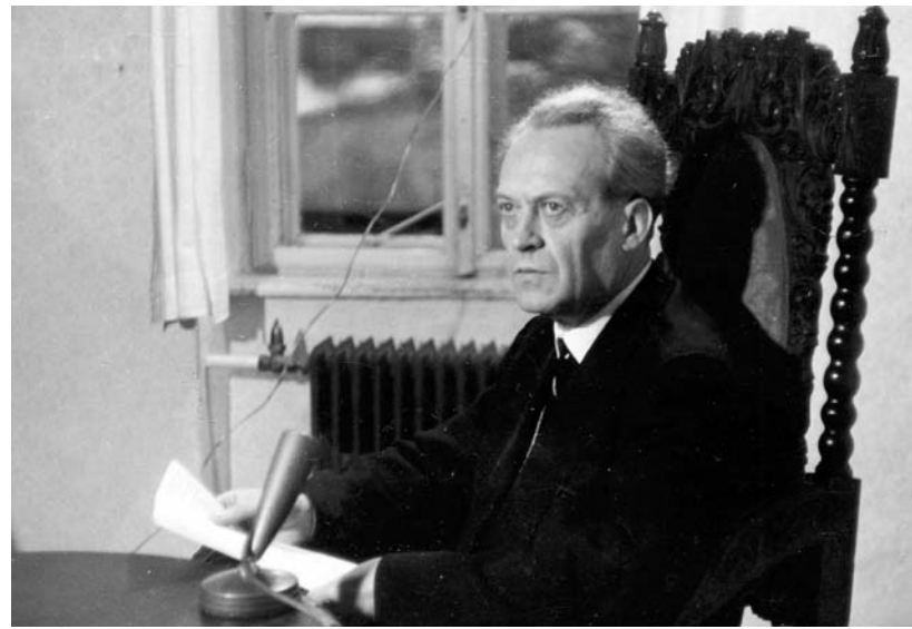
Ordass Lajos rádióüzenetének a felvétele