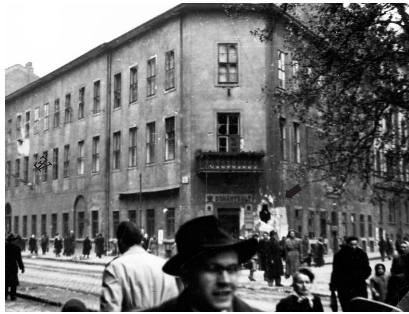
Belövés az MEE Üllői úti kollégiumának épületén