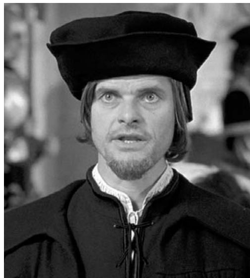
MELANCHTHON FÜLÖP ERIC TILL LUTHER-FILMÉBEN

Azelőtt a cselekedetekről szóló tanítással gyötör-