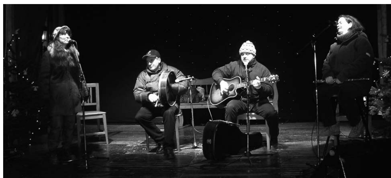
Az Édaín együttes karácsonyi koncertje a Vörösmarty téren

Az Édaín együttes eddig megjelent cédái kaphatók az evangélikus könyvesboltban (1085 Budapest, Üllői út 24.). A Thar Sáile. A tengeren túl című album ára 2500, a Rí na mBocht. Szegények királya című korong 2900 forint.