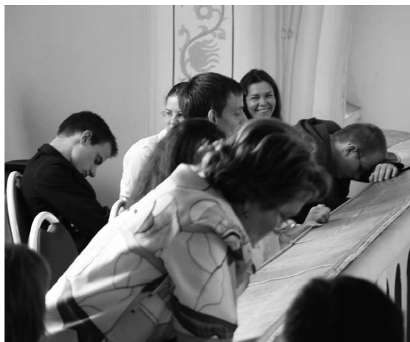
Az egyházkerületi kórustalálkozó eredményhirdetésére várva...