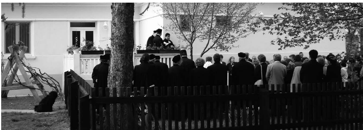
Senki nem mondhatja, hogy még a kutyát sem érdekelte a parókiaszentelés...