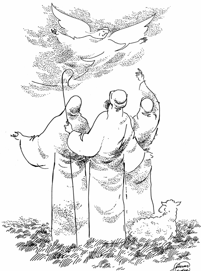
SIMON ANDRÁS GRAFIKÁJA