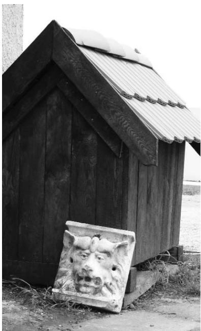
A kép alapján vajon milyen házőrzőt tartanak a bobai parókian?

Természetesen nemcsak telefonálónk, hanem személyes érdeklődőink is vannak. Egyikük nemrég például a „Szentatyát” kereste a kaputelefonunknál... De olyan is előfordult már, hogy engem női minivoltomban apácának tituláltak.