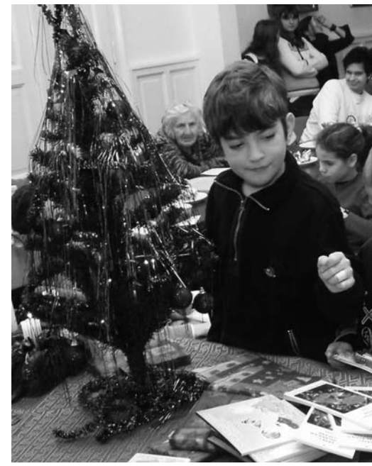
Gyerekeiket egyedül nevelő anyák karácsonya az Üllői úton –

Nem sokkal dél előtt ért haza az apa. A gyerekek boldogok voltak, mert – bár hozzászoktak –, nem szerettek egyedül lenni, és mert olyan jó volt, amikor ve- lük volt az édesapjuk. De örömük ha- mar szertefoszlott. Apjuk elpanaszolta, hogy vásárolni ment, de már nem ka- pott semmit, mindenből kifogytak a boltok, és nem tudja, mit fogna enni az