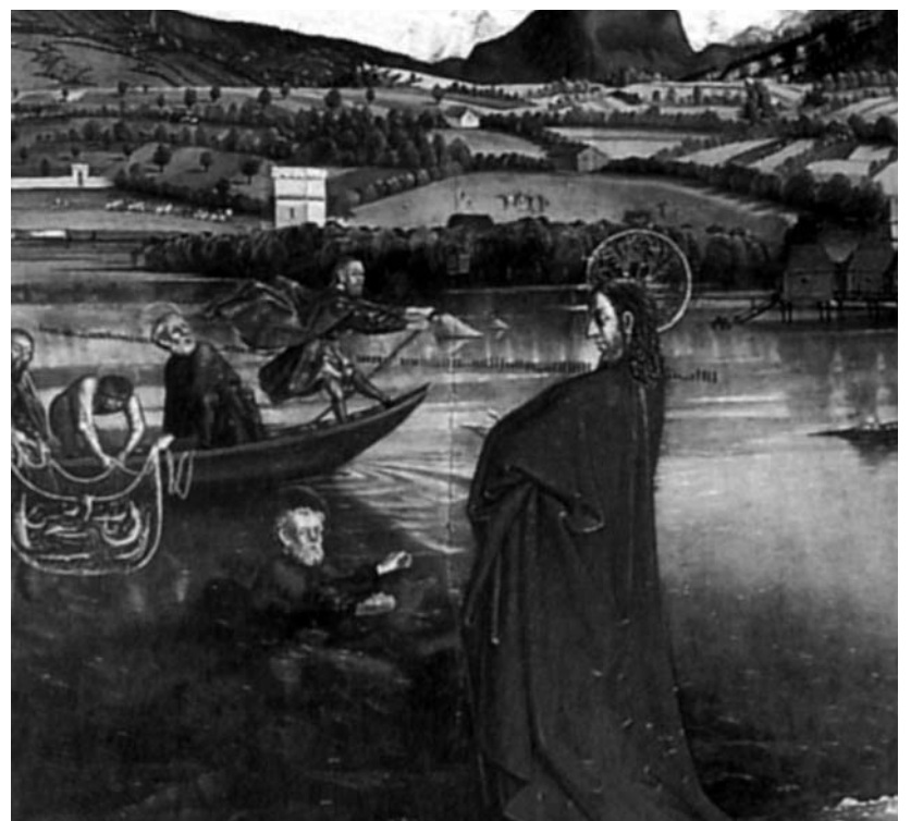
Komrad Witz: Csoda halászatkor (részlet, Genf, 1450)

Valaki könyörög értünk! Micsoda biztatást jelenthet már az a felismerés is, hogy emberek imádkoznak értünk! Például amikor egy lelkész megtudja, hogy hívei imádkoznak érte. Vagy amikor egy beteg arról értesül, hogy a testvérek közössége imában hordozza őt. Luther egy helyen arról ír, mennyire megrendítette őt az a felismerés, hogy az ő Lénája és