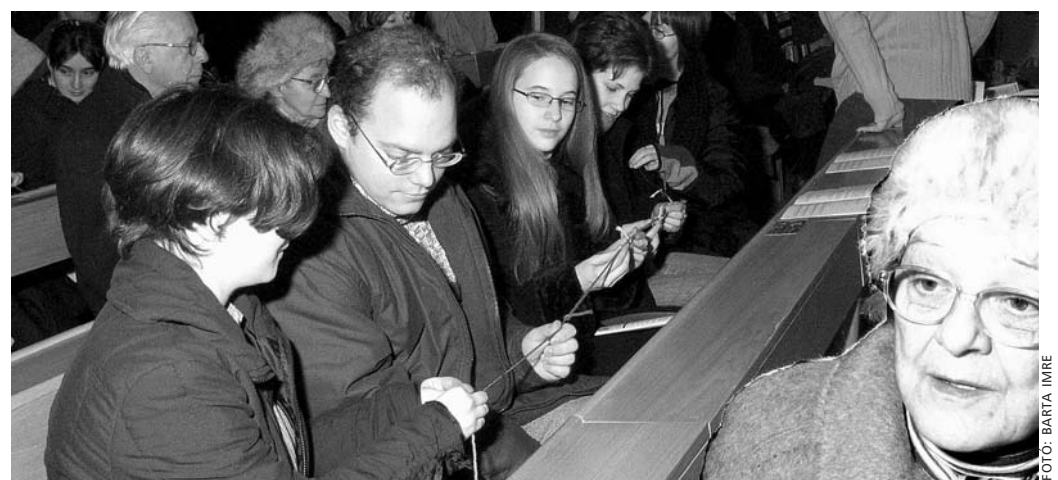
Az imahetet záró budapesti ifjúsági istentisztelet résztvevői a Magyar Szentek templomában, kezükben a keresztény egységet szimbolizáló színes szalaggal

Hadd fűzzek néhány szubjektív megjegyzést a témához.