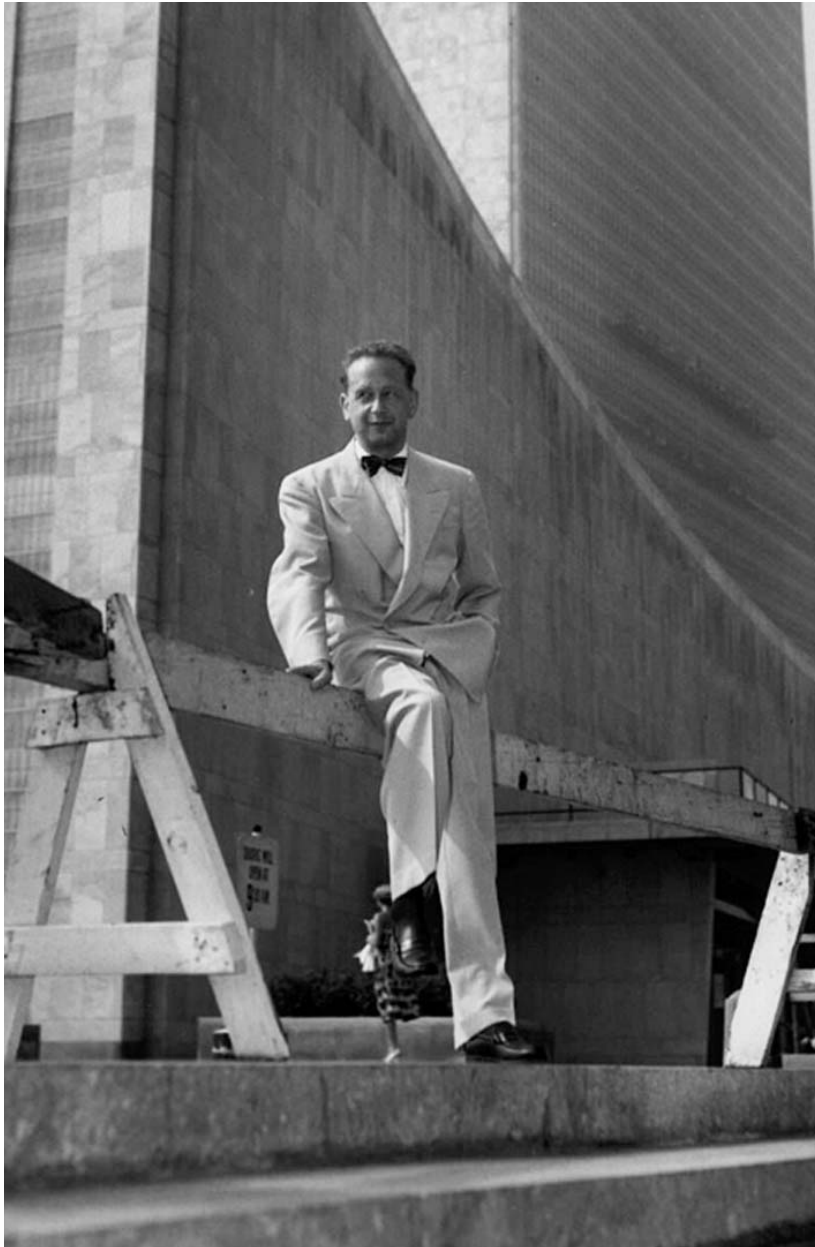
Dag Hammarskjöld New Yorkban, 1953 júniusában

Meglepő lehetett, de sokatmondó tény, hogy léopoldville-i (ma Zaire, akkor Kongó) hotelszobájában, ahonnan utolsó missziós útjára indult, személyes dolgai között a nagy középkori misztikus, Kempis Tamás Krisztus követése című könyvecskéjére találtak. Utólag az is elgondolkodtató, hogy a repülőtérré vezető úton egy svéd munkatársával a középkori misztika szeretetfogalmáról beszélgetett. A közvélemény ezt a két tényt a főtitkár vallásos érdeklődésének magánterületére utalta, nem is tulajdonított ennek különösebb jelentőséget. Pedig... Később New York-i lakásában, a hagyaték között találtak egy levelet, amelyben ezt írta egy diplomata barátjának: „Feljegyzéseim az egyedüli hiteles portrét mutatják fel, amelyet rólam bárki is készíthet. Az utóbbi években éppen ez indított arra, hogy kiadását mérlegeljem, annak ellenére, hogy ezt a naplót továbbra is magamnak s nem a nyilvánosságnak szántam. Ha ezt a naplót valamennyire is érdemesnek tartod a kiadásra, feljogosítalak, hogy azt fehér könyvként, amely tartalmazza saját dolgomat és ügyemet Istennel is, nyilvánosságra hozd.”