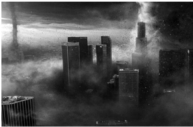
Az időjárásváltozás egy elképzelt forgatókönyve – jelenet a Holnapután című filmből