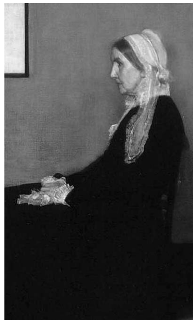
JAMES ABBOTT MCNEILL WHISTLER PORTREZSZELETE

nagyanyák ők? Vagy inkább dédanyák már? Ki figyel rájuk, nyomukba ki lép? Az utolsók-e, akik örök-védik ezeréves kultúránk gyökerét?