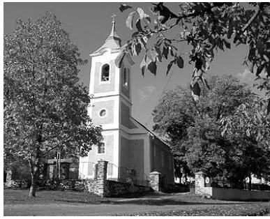
Monostorapáti evangélikus temploma