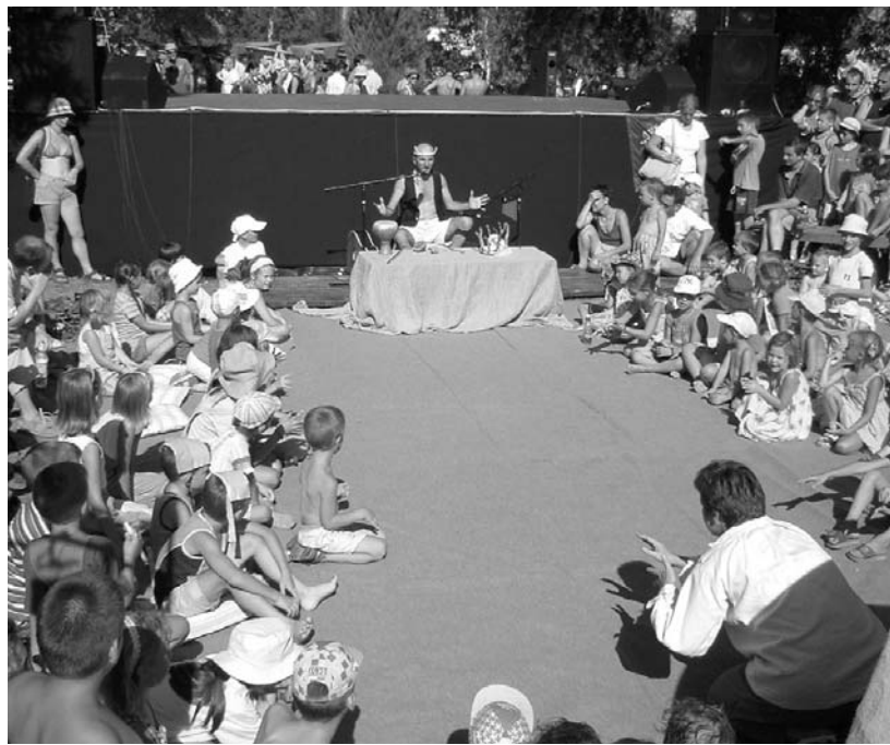
Pillanatfelvétel a tavalyi fesztiválról