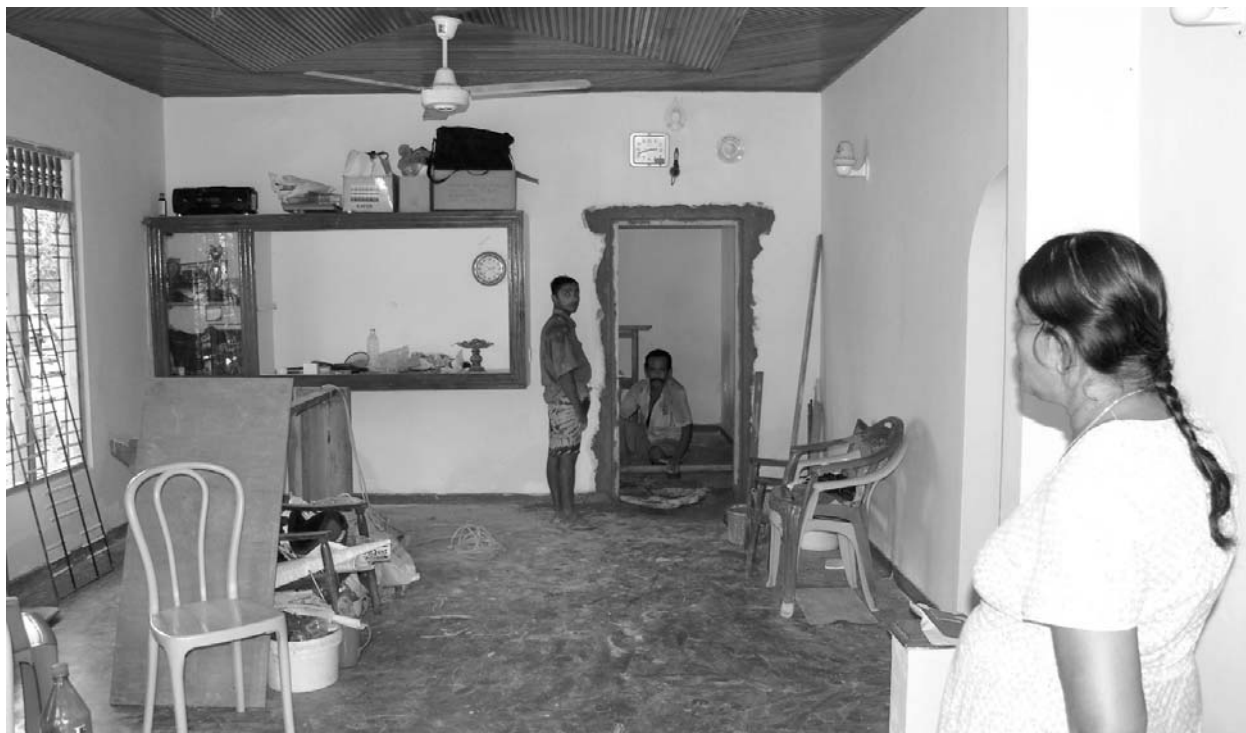
Belső felújítás közben