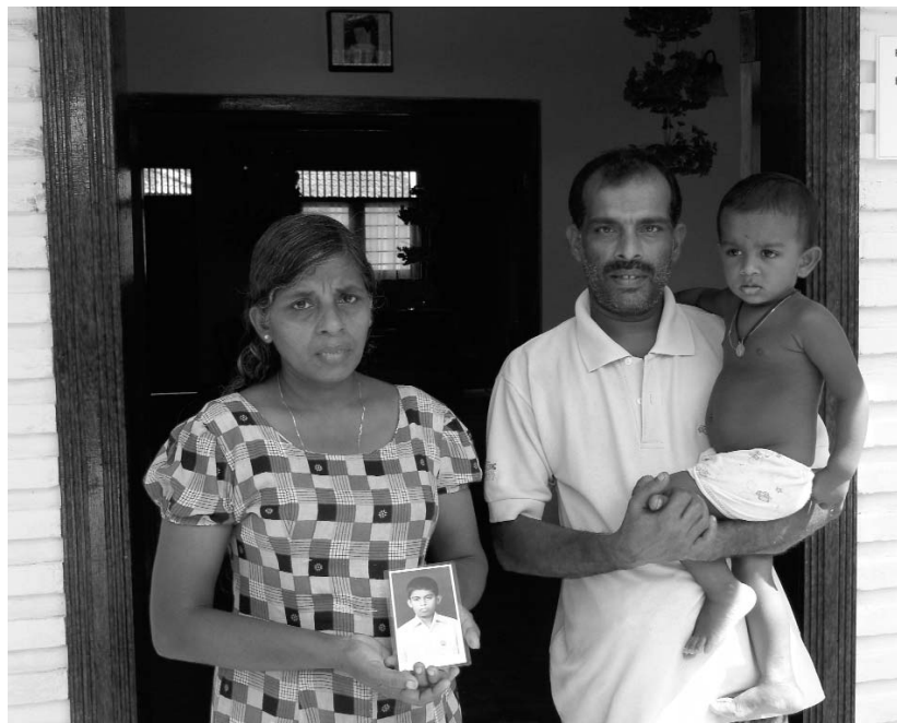
Egy felépített ház lakói