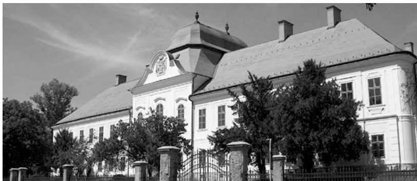
A hatvani Grassalkovich-kastély