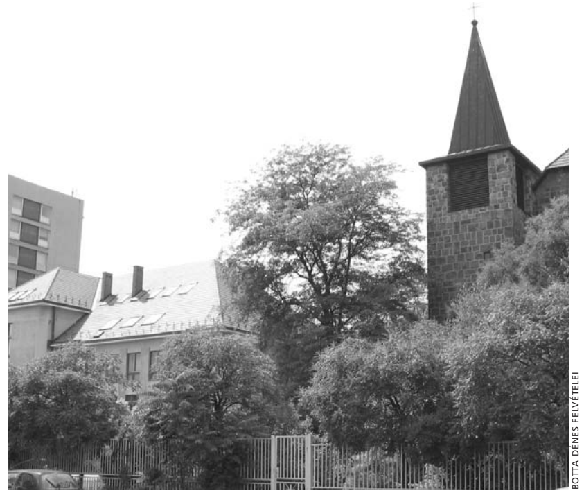
A hittudományi egyetem központi épülete és a zuglói evangélikus templom

– Igen, a jelölteknek mintegy a fele egyházi iskolából jött. Izgalmas kérdés ez, mert az ő képzésük magasabb szintről indulhat, hiszen ideális esetben nyolc, illet-