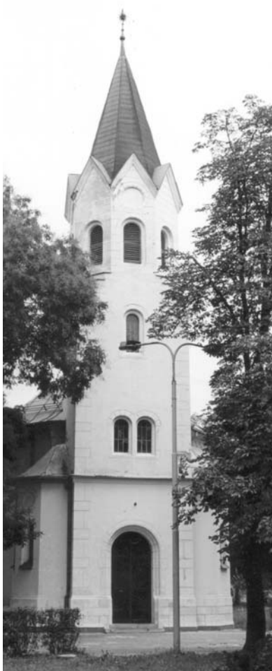
A település százéves református temploma

(A hertelendyfalvi református templomból július 24-én, vasárnap 10 órai kezdettel közvetített istentiszteletet a Duna Televízió.)