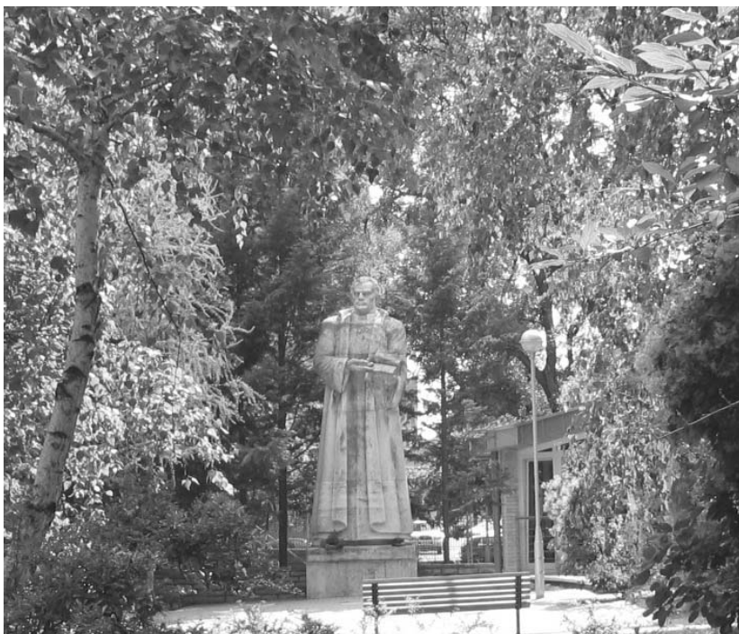
Luther Márton szobra a teológia kertjében

nak a hallgatók a modern nyelvek terén. Ez azért is fontos, mert a jövőben nehéz lesz elképzelni olyan végzett lelkeszt, aki sohasem járt ösztöndíjként külföldön.