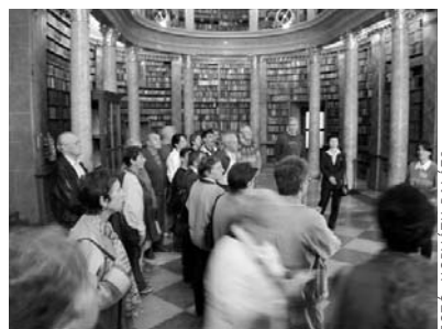
A pannonhalmi apátság könyvtárában

A mosonmagyaróvári egyházközség elnökségének régi terve volt, hogy testvérgyülekezeti kapcsolatot alakítson ki egy erdélyi gyülekezettel. Ez végül két esztendővel ezelőtt sikerült, mégpedig a Barcaságban élő – közelebről a hétfalui – csángók egyik gyülekezetével, a csernátfaluival. 2002 májusában Csernátfaluban, majd egy hónappal később Mosonmagyaróváron írták alá a két gyülekezet lelkesítői és felügyelői a testvérgyülekezeti kapcsolatot hivatalos szintre emelő dokumentumot.