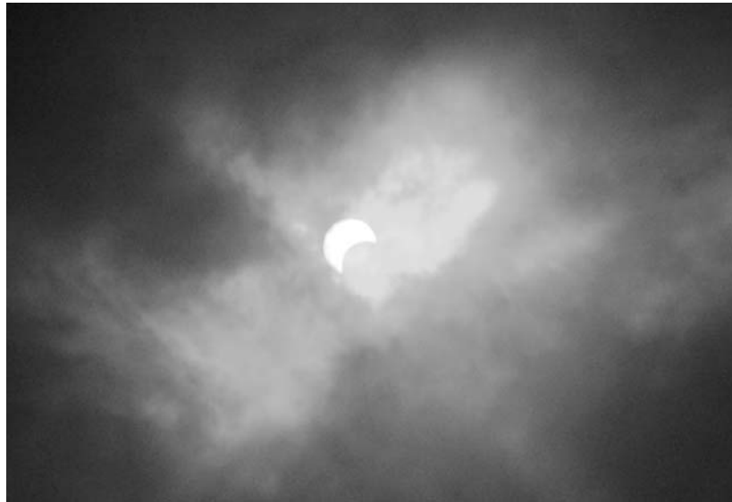
Az október 3-ai részleges napfogyatkozást Menyess Gyula örökölte meg Győrött