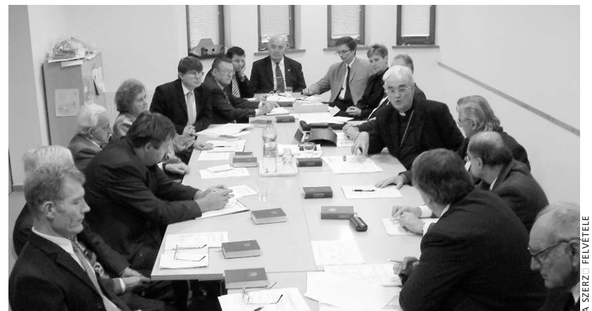
Ülésezik a presbiterium