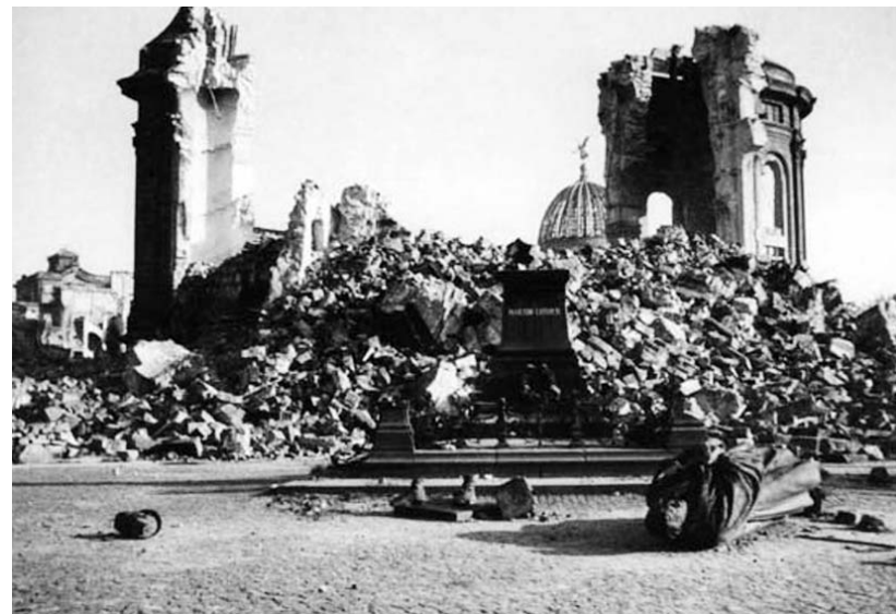
A rommá bombázott templom 1945-ben

A felújítás összköltségének a kétharmadát magánszemélyek és cégek teremtették elő, a legapróbbnak tűnő kezdeményezések révén. Drezdai taxikók például több éven keresztül minden megrendelt útból 1 penniget átadtak a templomépítési alapítványnak. Egy politikai fogoly, aki négy évet töltött az NDK börtönében, kártérítésének teljes összegét a felújítás céljára adományozta. Az adakozók között nem kevesen voltak a haj-