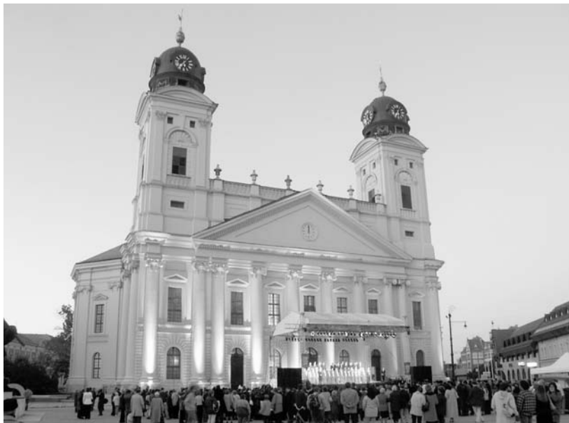
Ünnepi fesztiválynitó a Kossuth téren