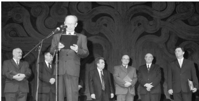
A műsorvezető mögött az egyházvezetők és a díjazottak

A rendezők ez alkalommal szünetet is iktattak a kulturális est programjába. A mintegy fél óra alatt a folyosói kivetítőn lehetett megtekinteni a Magyar Ökumenikus Segélyszervezetnek az árvíz sújtotta székelyföldi területeken végzett szolgálatát bemutató dokumentumokat (ez évben a kongresszusi központban a cserkészek is az árvízkárosul-