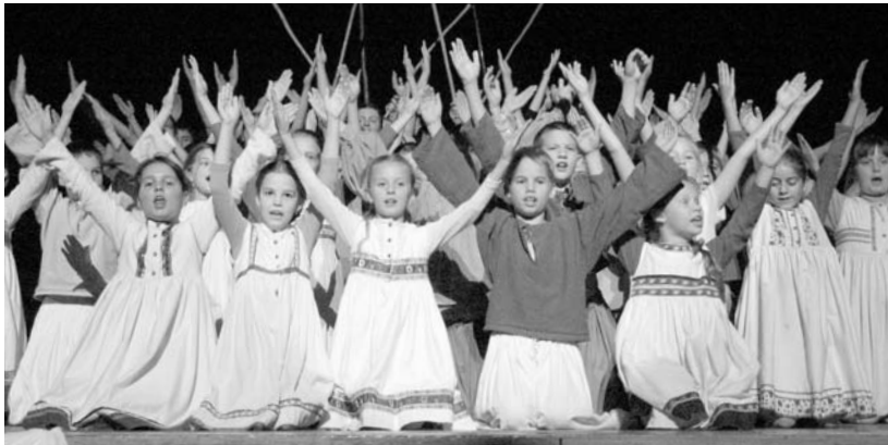
„A globalizációtól a keskeny úton a forrás felé” – pillanatkép a tatabányai Kenderke Művészeti Iskola tánckarának a protestáns kulturális esten előadott táncjátékából

Felépült az encsi evangélikusok temploma ▶ 3. oldal Három a püspökjelölt ▶ 3. oldal Dag Hammarskjöld „érkezése” ▶ 4. oldal Kórházmisszió melléklet ▶ 6–7. oldal Mit fogunk csinálni odafönt? ▶ 9. oldal A drezdai Frauenkirche üzenete ▶ 10. oldal