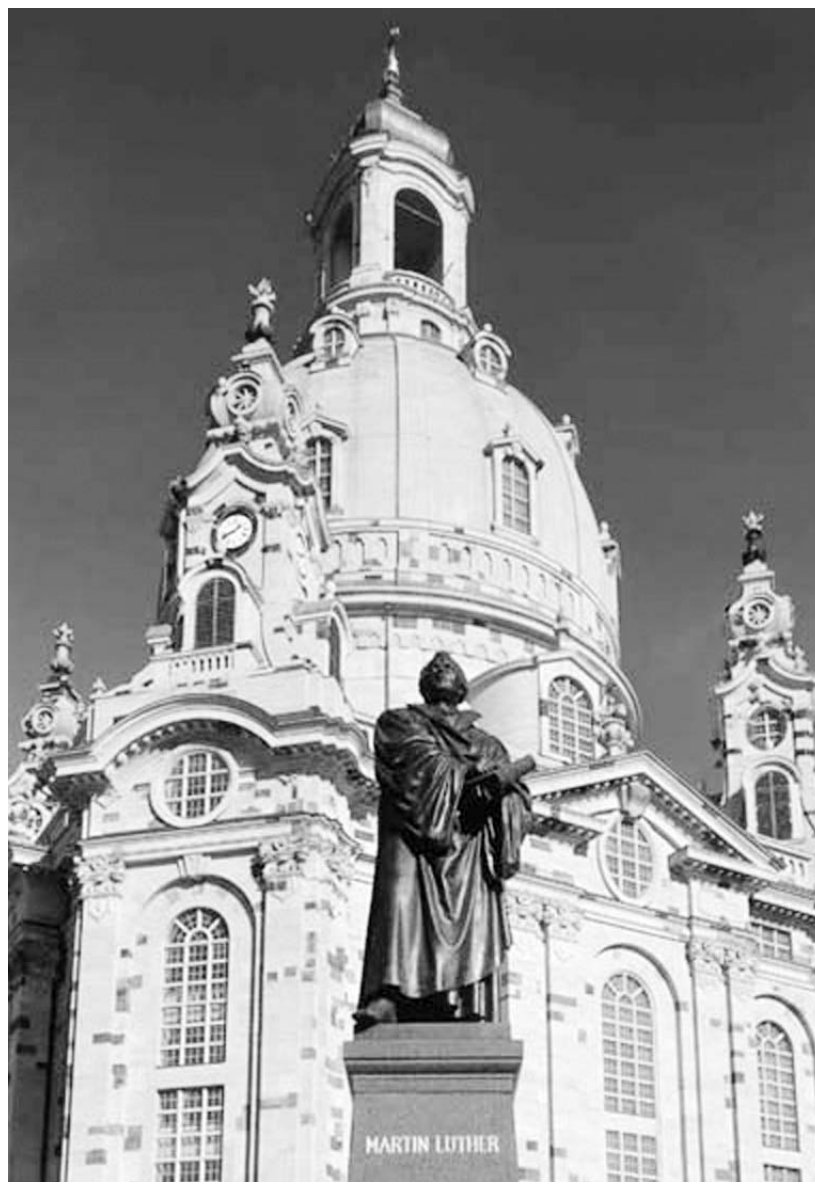
Luther szobra ismét a helyén – az újjáépített Frauenkirche előtt

Horst Köhler államfő a siker titkát a többlethitben és reménységben összegezte ünnepi szavaiban: „A kezdeményezők számára világos volt: egy város több, mint az épületeinek az összessége. Egy város a lakói tartásából és cselekvő erejéből él. Ezek pedig azok, akik a város javát keresik, ahogyan azt már Jeremiás próféta is megmondta.”