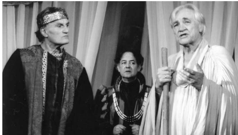
MILOS JOSEF FELVÉTELE

Jelenet az Evangelium Színház A próféta című darabjából. További előadások: november 20., 27., december 4. – 16 óra; november 19., december 3. – 19 óra. Jegyárúsítás mindennap az 1/250-5338 telefonon és hétfő, szerda, péntek délután 14–18 óra között a Duna Palota portáján (Budapest V., Zrínyi u. 5., tel.: 1/235-5500). Helyárak: 1600, 1200, 1000 forint.