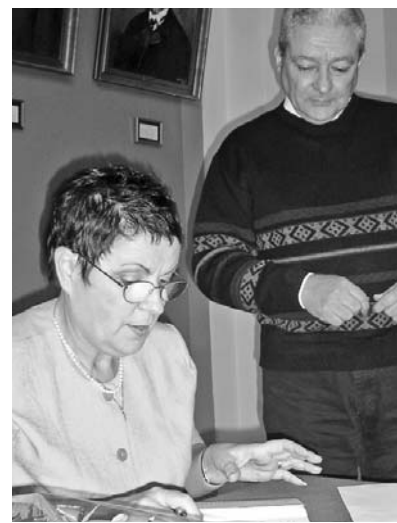
A kötet a Luther Kiadó Üllői úti könyvesboltjában is megvásárolható, ára 2490 forint.