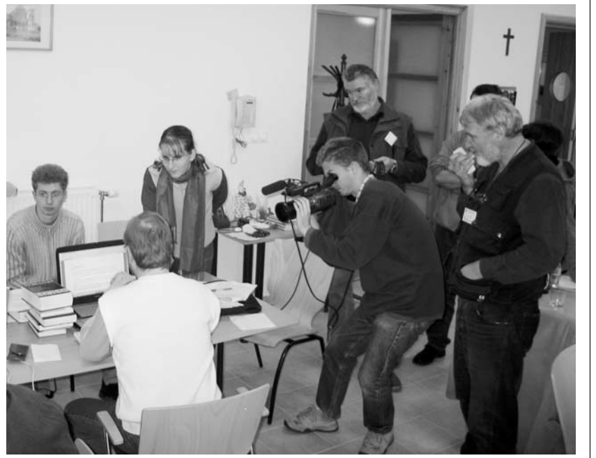
Ismerkedés a kamerával – lencsevégen a helyszíni kéziratgondozás

(A lapzártá után beérkezett fotókból következő számunkban közlünk. – A szerk.)