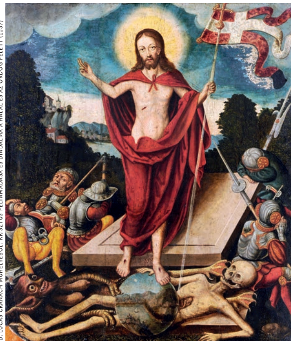
ID. LUCAS CRANACH MŰHELYÉBŐL: KRISZTUS FELTÁMADÁSA ÉS DIADALMA A HALÁL ÉS AZ ÖRDÖG FELETT (1537)

Mi elkeseredünk a világban tapasztalt sötét hatalmak munkálkodása miatt. A milliokat sújtó éhezés, nyomor,