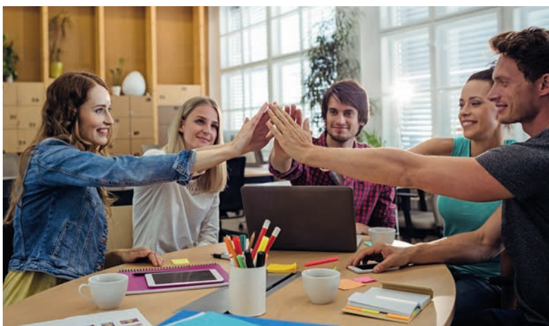
KÉPINK ILLUSZTRÁCIÓ

Szép ez. Gyönyörűsége. „Olyan, mint a Hermón harmatja, amely leszáll a Sion hegyére.” És jól tudjuk a Szentírásból, az em-