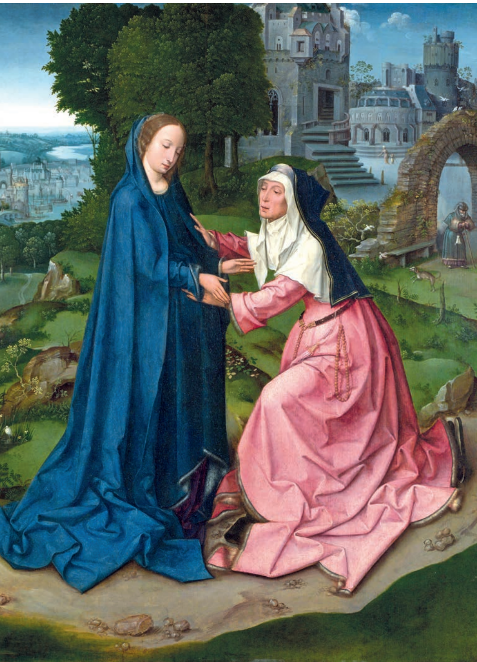
ISMERETLEN MESTER (1510): SZŰZ MÁRIA LÁTOGATÁSA SZENT ERZSÉBETNÉL

dicstelen halála miatt jött létre. Mária sem az alázatosság érzésére utal, hanem a megalázott társadalmi állapotra, amelyet ő maga is átél, és talán népe is, a Római Birodalom elnyomó és igazságtalan struktúráinak részéről.