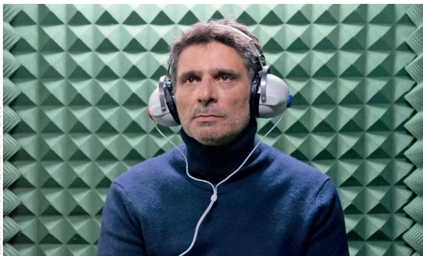
JELENETFOTÓ A VALAKI HALL ENGEM CÍMŰ FILMBŐL.

A Valaki hall engem , mondhatjuk, „klasszikus francia romantikus vígjáték”, amelyben van balek, de jólelkű barát,