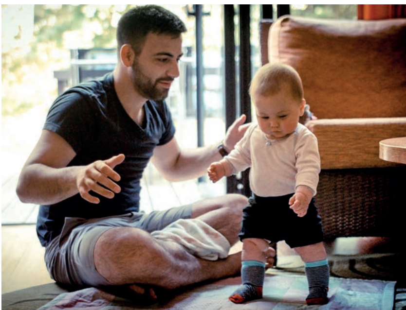
KÉPŐNK ILLUSZTRÁCIÓ

Ha az Istennel való kapcsolatunk a benne való bizalom mentén rendeződik, akkor történik meg az, hogy nem keverednek össze a dolgok, és nem a magunk eszére, nem a vagyonunkra és nem a jó egészségünkre építjük az életünket, hanem arra a gondviselő Istenre, aki ismeri a gondolatainkat és a tévútjainkat, a valódi értékeinket, a betegségeinket és a fájdalmainkat.