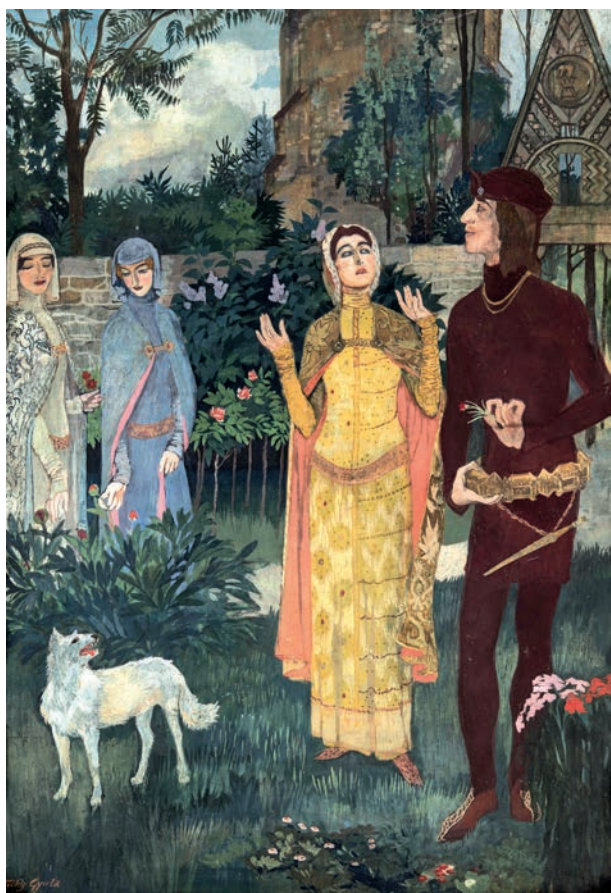
Királyasszony néném II. (1908)