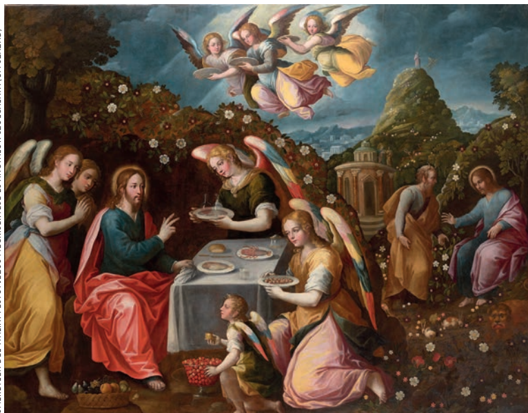
ISMÉRTLEN DÉL-ITALIAI FÉSTŐ: JÉZUS MEKKÉSÉRTÉSE ÉS ANGYALOK SZOLGÁLATA (17. SZÁZAD)

Példakép a szenvedésben. Vajon hogyan tudnék imádkozni egy végtelen, örök Mindenhatóhoz, ha nem tudom, hogy azt a szenvedést, azt az emberi sorsot ő is átélte Krisztus, az én testvérem által? Ő az, aki végső kintartásra biztat, mert ő az, aki átélte, megélte ugyanezt.