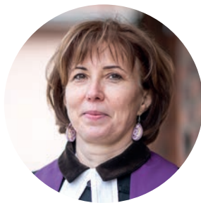
Ihsz Beatrix esperes Soproni Evangélikus Egyházmegye