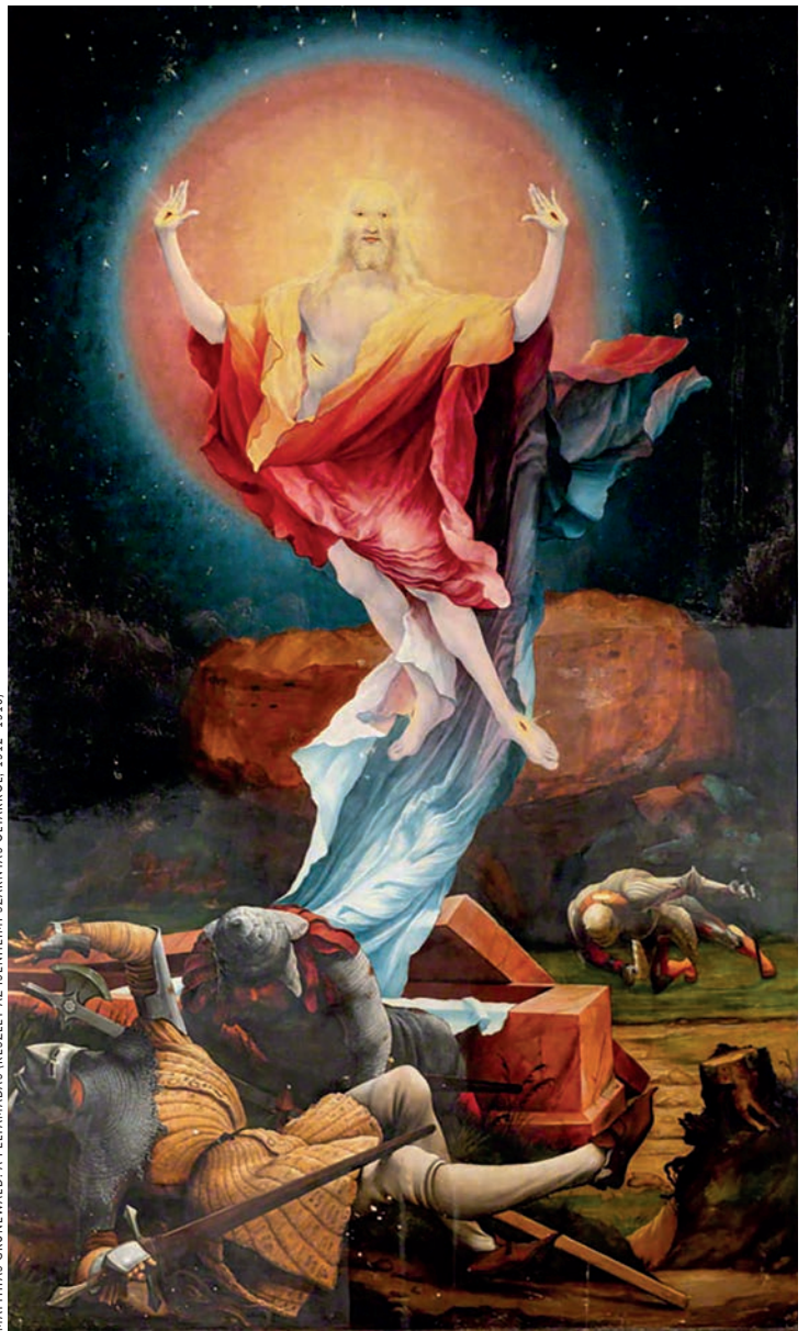
MATTHIAS GRÜNEWALD: A FELTÁMADÁS (RÉSZLET AZ ISENHEIMI SZÁRNVAS OLTÁRRÓL: 1512-1516)

Ha annyi hitünk lenne, mint egy mustármag, akkor szükség esetén egy-egy hegyet is odébb küldhetnénk. Az Úr itt a korabeli rabbinista, költőien túlzó megfogalmazást használja: „Bizony mondom néktek, hogy aki azt mondja ennek a hegynek: Emelkedjél fel, és vesd magadat a tengerbe! – és nem kételkedik szívében, hanem hiszi, hogy amit mond, az megtörténik –, annak meg is adatik az.” (Mk 11,22–23) A gondolatot Pálnál is megtaláljuk a szeretet himnuszának elején: „...ha teljes hitem van is, úgyhogy hegyeket mozdíthatok el...” (1Kor 13,2) Az így ható hit persze a rendkívülinél is rendkívülőbb karizma (1Kor 12,9) lenne. De nem tarthatjuk eleve kizártnak, hogy valahol, vala-