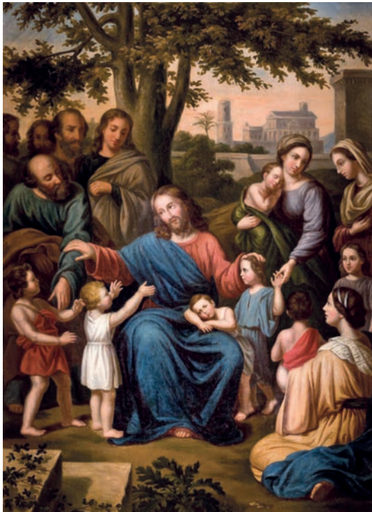
ISMERETLEN FRANCIA FÉSTŐ: ENGEDIÉTEK HOZZÁM JÖNNI A GYERMEKEKET (19. SZÁZAD)

A mimészis, a követés, az utánzás alapja nem más, mint a krisztusi szeretet és az ezzel szorosan összekapcsolódó megbocsátás képessége. Ahogyan a 4. fejezet utolsó versében olvassuk: „ Viszont legyetek egymáshoz jóságosak, irgalmasak, bocsássatok meg egymásnak, ahogyan Isten is megbocsátott nektek a Krisztusban. ”