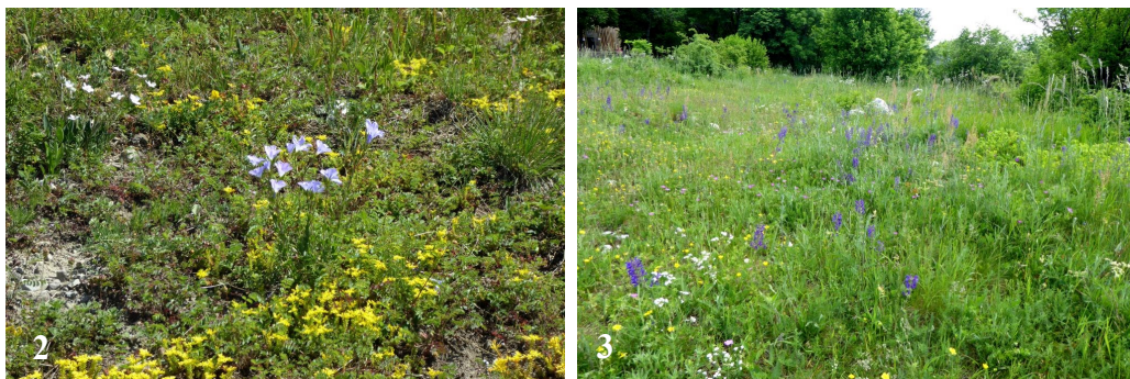
2. ábra. Sziklagyep borsos varjúhájjal ( Sedum acre L.) és borzas lennel ( Linum hirsutum L.). Fig. 2. Calcareous grassland with goldmoss sedum and Linum hirsutum L.

Fig. 1. Birds-eye view of Pilis hilltop with visible concrete bunkers.