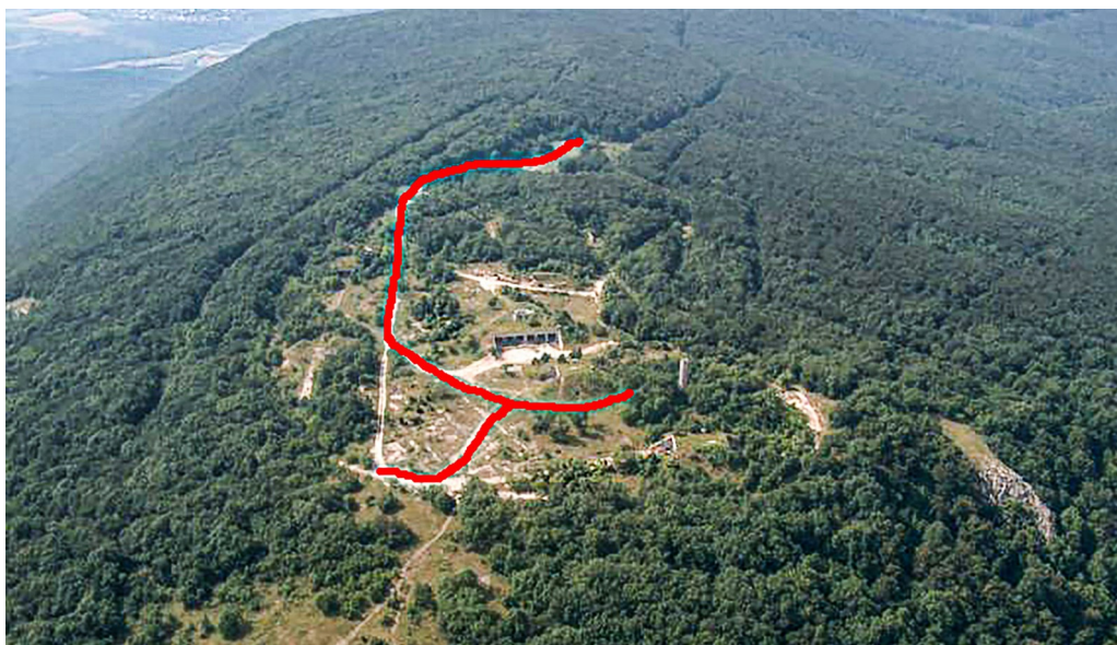
4. ábra. A transekt Fig. 4. Transect