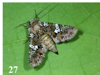
25-28. ábra / Figures 25-28. 25. Orbona fragariae (Kistápé, 2024. 02. 27.); 26. Mesogona oxalina (Nagydorogi Szenes legelő, 2019. 90. 08.); 27. Hadena albimacula (Kistápé, 2022. 05. 26.); 28. Xestia sexstrigata (Kistápé, 2020. 08. 11.). A méretarányok eltérőek/The scales are different.