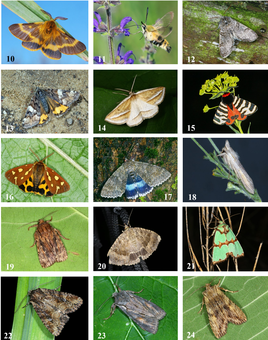
10-24. ábra / Figures 10–24. 10. Lemonia dumi (Kistápé, 2022. 11. 01.); 11. Hemaris tityus (Nagydorogi Szenes-legelő, 2022. 05. 11.); 12. Achlya flavicornis (Kistápé, 2022. 03. 28.); 13. Archiearis parthenias (Kistápé, 2021. 03. 01.); 14. Chariaspilates formosaria (Kistápé, 2024. 06. 16.); 15. Arctia festiva (Bikácsi Ökör-hegy, 2011. 04. 27.); 16. Hyphoraia aulica Bikácsi Ökör-hegy, 2023. 05. 20.); 17. Catocala fraxini (Kistápé, 2020. 08. 11.); 18. Cucullia balsamitae (Bikácsi Ökör-hegy, 2018. 05. 22.); 19. Amphipyra cinnamomea (Kistápé, 2023. 09. 22.); 20. Mormo maura (Kistápé, 2023. 09. 12.); 21. Staurophora celsia (Nagydorogi Szenes legelő, 2023. 10. 03.); 22. Apamea unanimitis (Kistápé, 2018. 05. 04.); 23. Lithophane furcifera (Kistápé, 2022. 04. 26.); 24. Lithophane socia (Kistápé, 2023. 09. 12.). A méretarányok eltérőek/The scales are different.