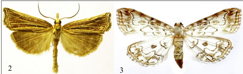
2-3. ábra. Ancylolema tentaculella (2), Elophila rivulalis (3) ritka és lokális Magyarországon. Részletes ismertetés az alábbi szövegben. (eltérő mértéarány) Figure 2-3. Ancylolema tentaculella (2), Elophila rivulalis (3) rare and local in Hungary. Detailed description in the text below. (different aspect ratio)

Pastorális & Buschmann 2018-as névjegyzék alapján. Ez utóbbi munkát a közelmúltban fejeztem be. Gyűjteményem – mint az összesítésből kiderült, – 38 500 példányt tartalmaz. Időközben megkezdtem a benne lévő fajok és példányaik adatainak közzétételét is, amely a Brachodidae, Coleophoridae, Cossidae, Limacodidae, Pyralidae, Sesiidae, Thyrididae, Tortricidae, Zygaenidae családok esetében már megtörtént (Buschmann 2022, 2023, 2025a,b). Jelen dolgozatban a Crambidae család fajait veszem sorra. E családnál a gyűjteményemben található fajok száma 151, a példányoké 93 gyűjtőhelyről 4126 db. Egyéni gyűjtésekből 3543 példány van, az alkalmilag társakkal (Balla Gizella, Bánkúti Károly, Benedek Balázs, Halász Sándorné, Pastorális Gábor, Szabóky Csaba, Takács Attila) végzett terepmunkákból származóké 501. További 67 példány Miklós Iván, Pastorális Gábor, Szabóky Csaba és Takács Attila gyűjtéseiből, három faj kilenc példányá pedig az Ignác Richter és Pastorális Gáborral közös egyetlen szlovákiai, a Chočské vrchy, Prosecka dolina-ban 2014.VII.4-én folytatott gyűjtésből ered. A külföldi kollégáktól (Branislav Endel, Ignác Richter, Pastorális Gábor, Zdenko Tokár) kapott fajok és egyedek száma 4, az Antigastra catalaunalis pedig Szabóky Csaba korzikai gyűjtésének eredményéből való.