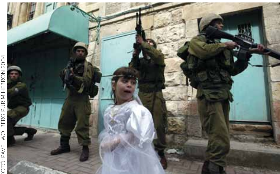
HEBRON 2004