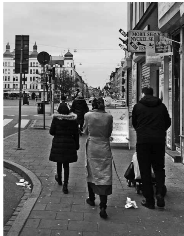
Tipikus svéd városi utcakép – skandináv hangulat?

A megkövült hagyományok és elavult vallási dogmák irányította korlátozott világszemlélet kialakulását nagy mértékben a fejlődésben elakadt társadalmi háttér magyarázza. És hogy valami hiányzik, és nem csak a betevő falat meg a tűzszünet, az ékesen bizonyítja a nyugat felé törekvő emberáradat, akik közül a legtöbben nem az éhhalál és a golyózápor elől botladoznak át a legközelebbi országhatáron, hanem nagyon is céltudatosan igyekeznek egy fél kontinensen át a liberális, toleráns és elvilágiasodott társadalmak felé.