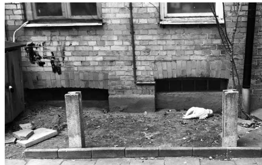
A lakbért fizeti az állam, de a lakók közül ki érzi magáénak, ki törődik ezzel az udvarral?

Lebecsüli a bevándorlók intelligenciáját az, aki nem látja be, hogy ők is tudják: nem hinni kell, csak felmondani a szerepet.