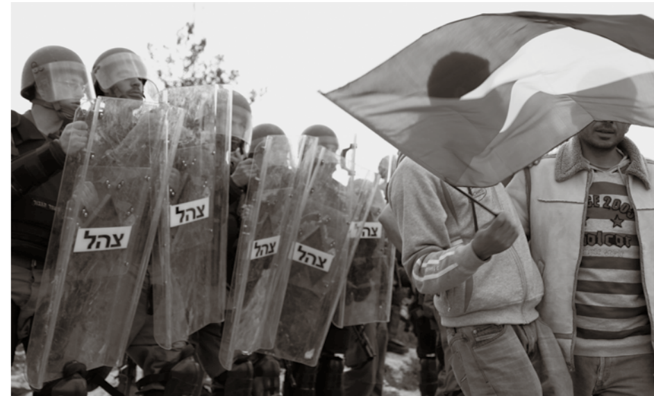
Palesztin és baloldali tüntetők a hadsereg sorfalával szemben Bilinben