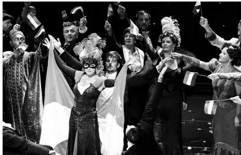
Az Operettszínház társulatát állva ünnepelte a közönség a Tel Aviv Operaházban.

Tel-Avivban is hasonló a helyzet: az eredeti bécsi operetthangulat és a váratlan fordulatokban gazdag zenés színházi élmény egy átmulatott éjszaka pezsgőbe áztatott történetével – amelyet az Operett társulata ígért – óriási tömegeket mozgatott meg Izraelben. Az előadás – amely több ízben délután, majd este ismét előadásra került, és minden alkalommal telt házzal futott – pontosan az, amit a hajóhangárok, vagy lakásszínházak nem tudnak visszaadni.