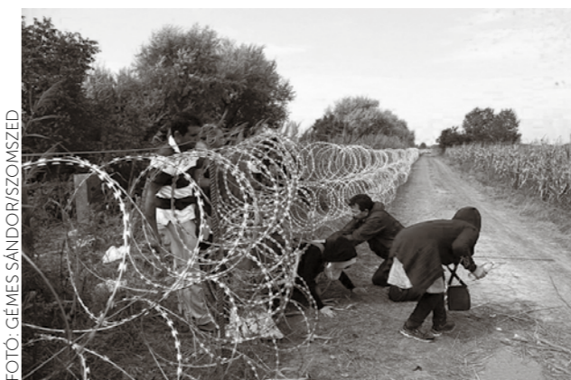
Az EU elvárásaival szemben Görögország nem állította meg a menekültáradatot

Az Európai Unió a szír válság miatt igyekszik elnyerni a törökök szimpátiáját. A dolog pikantériája, hogy míg régebben az EU Görögországtól várta el a menekült-hullám megfékezését, most inkább Törökországban látják a megoldást. Engedve a török zsarolásnak, megszavaztak hárommilliárd euró gyorssegélyt a számukra (amit időközben tízmilliárdra módosítottak). Érdekes módon, amikor a görögök szorult helyzetbe kerültek,