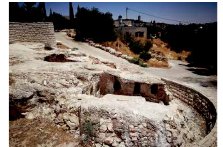
Szentély-korabeli sírok közvetlenül a kilátó alatt.