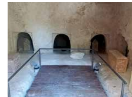
Nikanor barlangja, ahol Uzsiskin a nemzeti panteont akarta létrehozni. Itt találták meg a „ajtóépítőről” szóló feliratot.