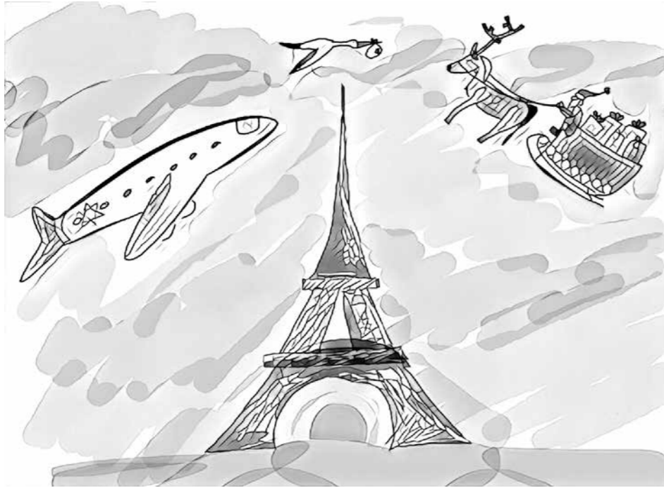
GRAFIA: SALAMON SÁRA

dolkodtam el magamban –, inkább fordítva. Nekem tartoznak, de azokra mindre kérészet vehettek. Pusttán csak egy apróságot hagytam ki, mégpedig azt, hogy a feleségem olé hadasként jött az országra, és az a „segítségcsomag”, ami kimerült egy repülőjegyen és a pár sekel kezdő zsebpénzben, öt évig tartozásnak számít.