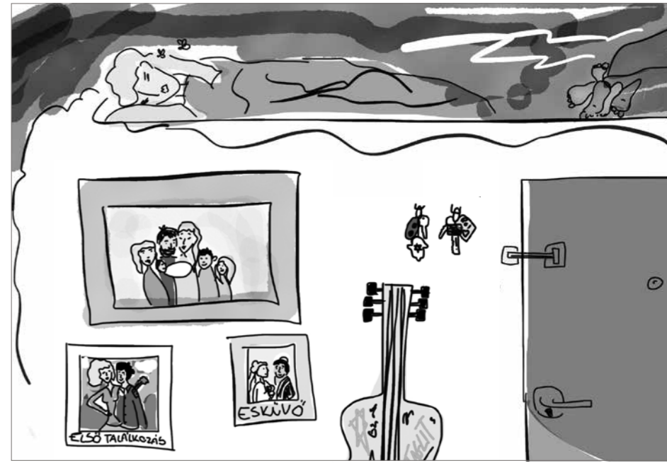
GRAFIA: SALAMON SÁRA