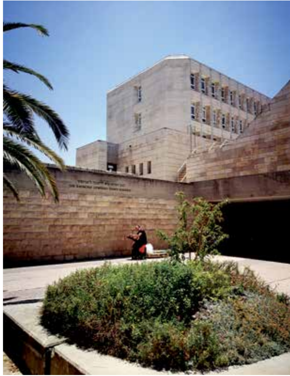
A Jeruzsálemi Héber Egyetem egyik nyolcvanas évekből épülete és a botanikus kert átjáró az épülethez.

A Héber Egyetem Izrael másodikként alapított felsőoktatási intézménye és az első, ahol héberül tanítottak. Ma is az ország legszínvonalasabb és legelismertebb egyeteme, a világon is a vezető százba tartozik. Alapkövét 1918-ban tették le, az alapítók között találhatjuk Albert Einsteint és Sigmund Freudot is. Az oktatás 1925-ben kezdődött meg, ami az 1947–1949-es függetlenségi háborúig zavartalanul folytatható, ekkor viszont minden erőfeszítés ellenére a tanítást egészen az 1967-es háborúig fel kellett függeszteni. Az egyetemet Nyugat-Jeruzsálembé költöztették, ahol végül 1953-ban nyitották meg a máig is működő Givat Ram-i kampuszt. A '67-es