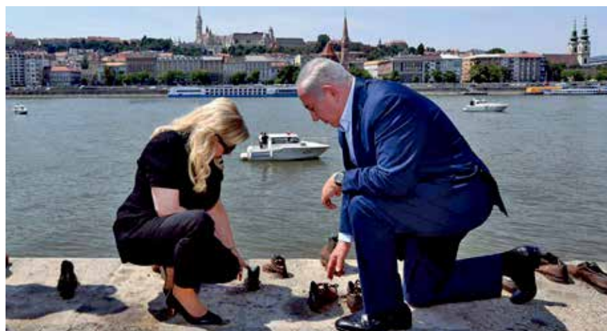
FOTÓ: BENYAMIN NETANYAHU FACEBOOK CHAM TZACH