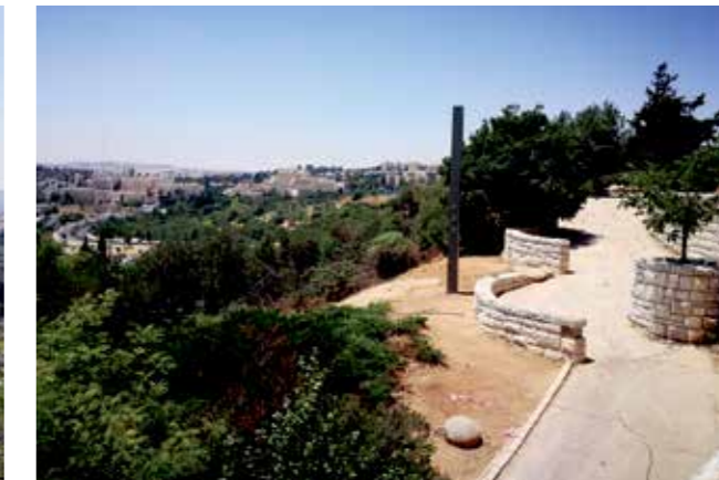
A Scopus-hegyi kilátópont a Héber Egyetem zsinagógája alatt, ahonnan a város nagy részét látni lehet.