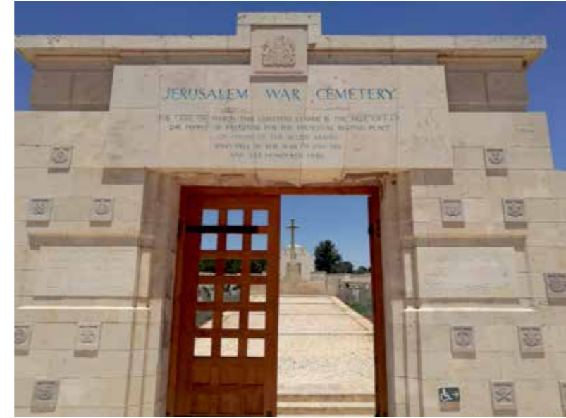
A Jeruzsálemi I. világháborús brit katonai temető bejárata. Az elesett katonák egyforma sírkövek alatt nyugszanak, melyek tövében szépen gondozott virágok nőnek.