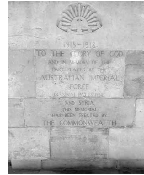
A környéken elesett ausztrál katonák emlékműve a brit katonai temető bejáratával szemben.