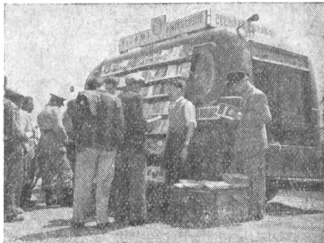
A „Guruló Könyvesbolt“ Pentelén

nevezni. Az ablakban csak néhány könyv díszelgett, nem igen keltettek feltűnést. Az első és legfontosabb feladat az volt, hogy a könyveket megfelelő formában propagáljuk. Könyvestáblákat készíttettem, ezekre a táblákra tettük ki a könyveket. Erre már felfigyeltek a dolgozók.