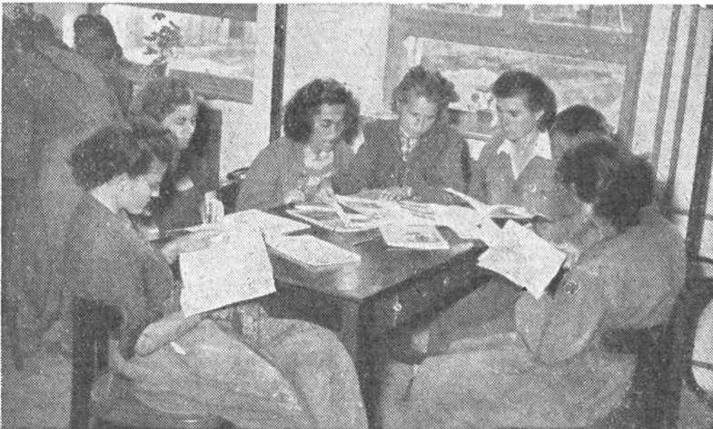
Kultúrteremben tanulnak, szórakoznak a dolgozók