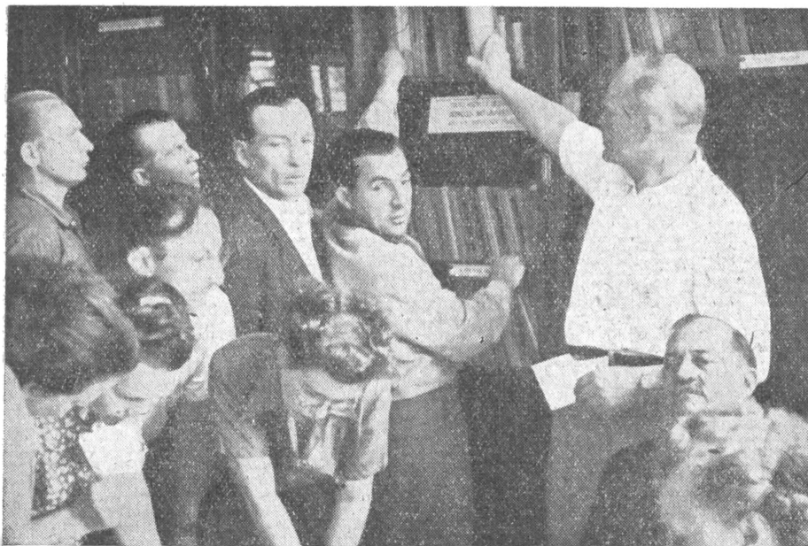
A Balatonlellén üdülő csehszlovák dolgozókat a debreceni Egyetemi Könyvtár által összeállított cseh, szlovák, orosz és magyar nyelvű könyvtár várta.