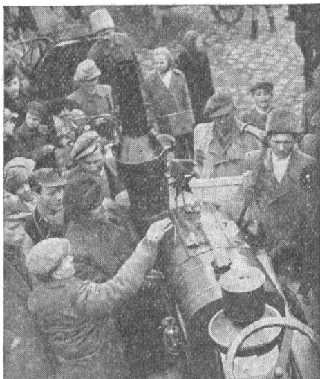
Indul az új traktor. Túrkevére