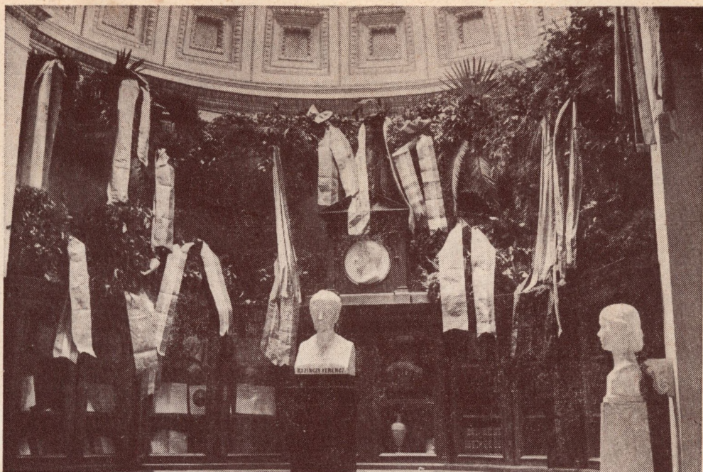
Kazinczy Ferenc mauzoleuma Széchalmon

A klasszikus irodalmunkat nagy kedvvel olvasók körében örömet keltett a Szépirodalmi Kiskönyvtár sorozatban megjelenő Kisfaludy Károly: A kőrök című vigjátéka. Vigjáték-irodalmunk elsői között foglal helyet ez a mű, 1819-ben írta szerzője és még ugyanebben az évben került először Pest város színházában bemutatásra. A most megjelent műhöz bevezető tanulmányt és magyarázó jegyzeteket Hegedüs Géza készített.