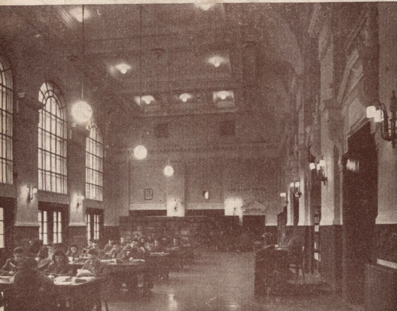
A debreceni Kossuth Lajos Tudományegyetem könyvtárának olvasóterme