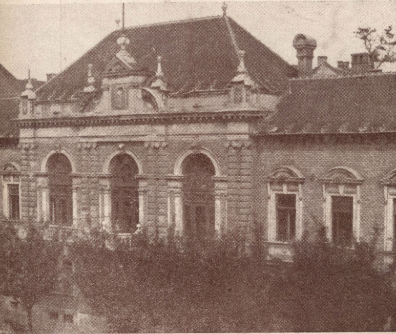
A Megyei Könyvtár épülete Miskolcon