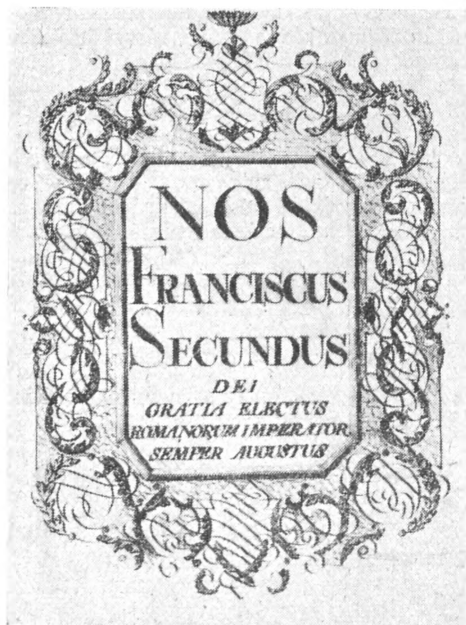
A Széchényi Könyvtár alapítólevele

A középkori könyvtár elzárt, egyházi monopóliuma után, nagyjelentőségűek a humanizmus és a reneszánsz világi kezdeményezései. Mátyás könyvtárát, a világhírű Corvinát egykorú leírások alapján makettben mutatja be a kiállítás. A XVI—XVIII. század haladó könyvtári kezdeményezéseit, a reakció fejlődést gátló hatását, a haladó és reakciós erőknek könyvtárügyünkben is jelentkező harcát a kiállítás könyvek, fény-