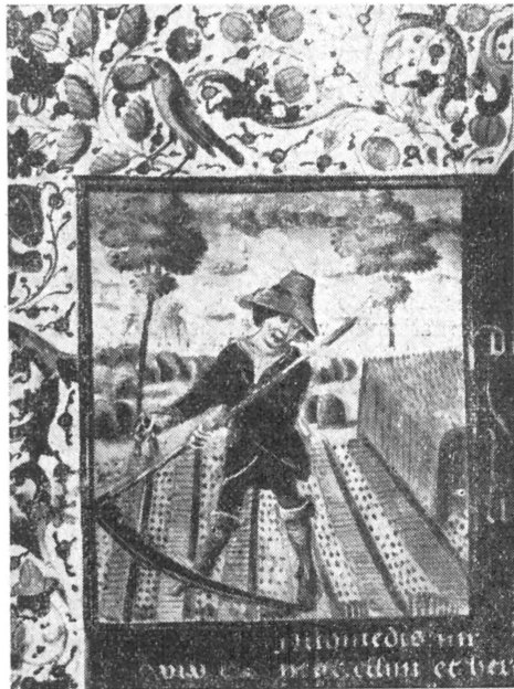
Aratás ábrázolása egy XV. századbeli kódexből.

A kiállítás a Széchényi Könyvtár 150 éves jubileumát ünnepli. Abban a tudatban teszi ezt — anélkül, hogy multja haladó értékeit megtagadná — hogy ez a könyvtár nem azonos a mult század elején alakított, kezdetben teljesen hozzáférhetetlen, majd fokozatosan az uralkodóosztály számára nyilvánossá váó, de a néptől továbbra is elzárkózó Széchényi Könyvtárral. Nem azonos az a könyvtárral, amelynek első írott szabályzata kimondja — s egészen a felszabadulásig további szabályzatai is átveszik —