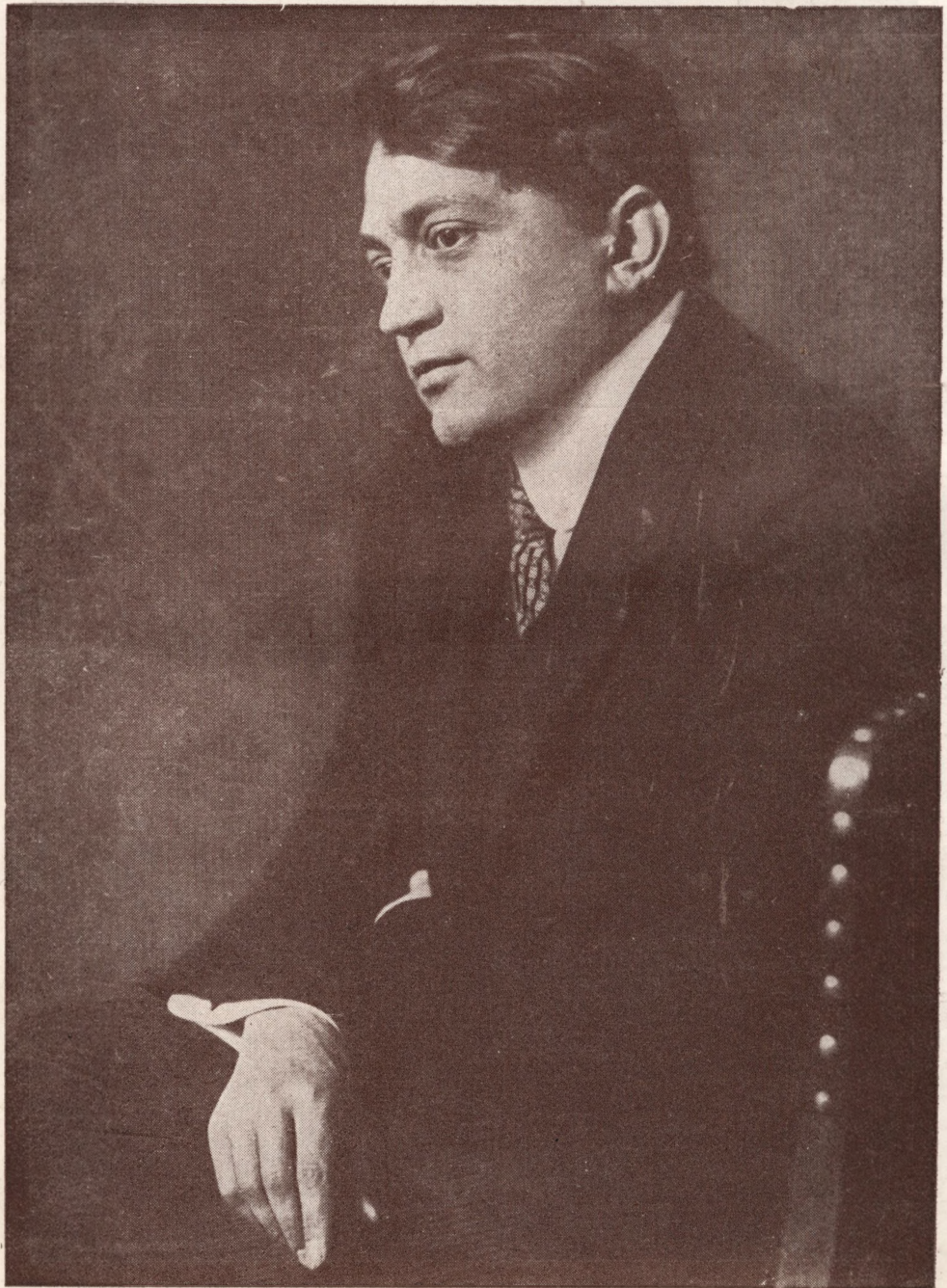
75 éve született Ady Endre.