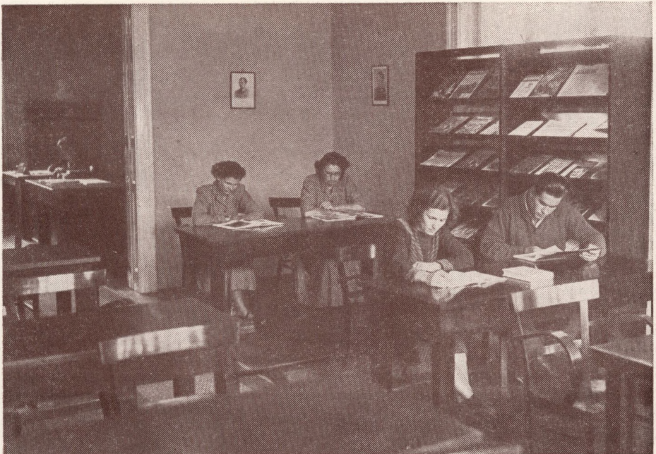
A kaposvári Megyei Könyvtár olvasóterme