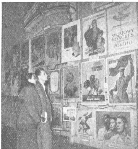
Békeplakát kiállítás a Szabó Ervin Könyvtár központjában.

Döntő fordulatnak kellett bekövetkeznie a könyvbeszerzésben is. A Horthy-rendszer könyvtárpolitikusai »érthető« okokból mereven elzárkóztak a szovjet könyvek beszerzése elől, tudomást sem vettek a Szovjetunióban és nyugati országokban született emigrációs magyar irodalomról. Ez csak a rendőrséget érdekelte a »hivatalosak« közül. Természetes, hogy még kevésbé voltak kíváncsiak az idegennyelvű haladó irodalomra, tudományokra. A reakciós beszerzési politika irányának megváltoztatása viszonylag hamar megtörténhetett. Rövid öt esztendővel a felszabadulás után, megnyitották a Szabó Ervin Könyvtár önálló szovjet osztályát is. Ugyancsak komoly fejlődést ért el a Fővárosi Pedagógiai Könyvtár is, amelyet 1946-ban