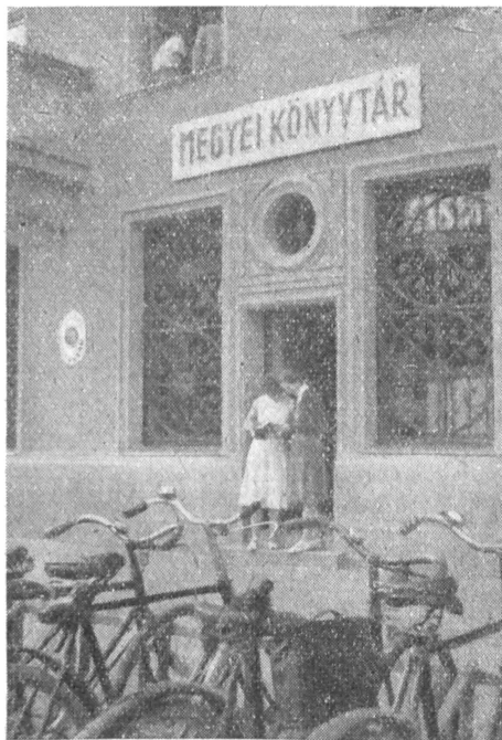
Nagy a forgalom a Vas Megyei Könyvtárban