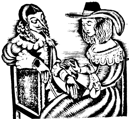
Molnár C. Pál fametszete: Illusztráció a Cyranohoz