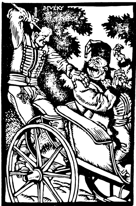
Divéky József fametszete: Illusztráció a Ludas Matyihoz

s csak mint vésnök dolgozott igen termékenyen. Többek közt »Az Osztrák-Magyar Monarchia irásiban és képben« számtalan illusztrációja került ki keze alól, illetve műhelyéből. Értékes szolgálatokat tett Munkácsy és Zichy Mihály rajzainak és festményeinek fadúcrá való átültetésével is.