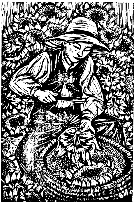
Gy. Szabó Béla fametszete: Napraforgóverő

A XIX. század második felében nálunk is elterjedt a fametszés Bewick-féle technikája. Múlt századi fametszőink közül a legnagyobb technikai felkészültséggel Morelli Gusztáv (1848—1909) dolgozott. Illusztrálta az egyik Petőfi-kiadást, s bár metszetei alkotóképes tehetségre valának, mégis elhallgatott mint művész,