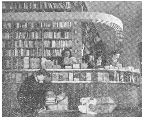
Készülődés az Ünnepi Könyvhétre a Sztálin út 45. sz. alatti könyvesboltban

A Szikra könyvek terjesztői a kiadványok eladását óriási lelkesedéssel végezték, a nagy politikai tömegmegmozdulások alkalmával, például a Baloldali Blokk nagygyűlésén az aktuális politikai kiadványokat rikkanccs módjára árusították. A legutóbbi helyekre is rendkívüli gyorsasággal, időt és fáradságot nem kímélve, szétvitték a politikai irodalmat, hogy új olvasókat szerezzenek.