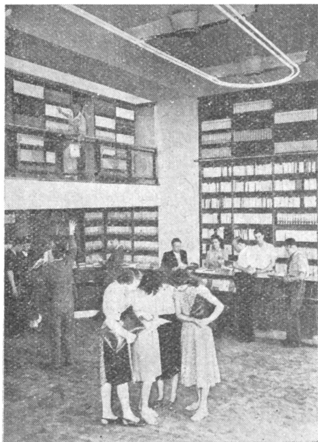
A Szabad Nép székházában lévő könyvesbolt

Üzemekben, hivatalokban, ahol nincs állandó könyvterjesztés, rendszeresen alkalmi vásárokat rendeznek, különösen fontosak ezek között a szakkönyvvásárok és a diákok közötti könyvadásítás. Egy-egy könyvvásáron sok és jelentős részben új olvasó veszi kézbe a könyvet