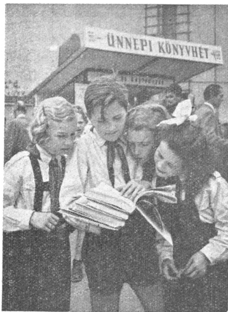
Az Ifjúsági Könyvkiadó sátra a Kálvin téren

Nagy volt az érdeklődés a politikai művek iránt is. A történelmi materializmus, A politikai gazdaságtan tan könyve, Kállai Gyula: A magyar függetlenségi mozgalom c. művének új kiadása nagy példányszámban fogyott. Teljesen elfogyott Russel: A horogkereszt rénettei c. mű második kiadása, úgy, hogy