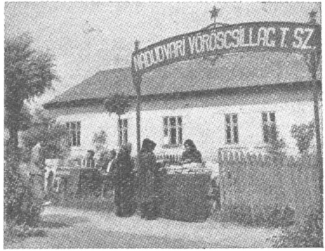
Könyvárusítás Nádudvaron az Ünnepi Könyvhéten

Bár a könyvterjesztés évközben nem mindig tud lépést tartani egyre javuló könyvkiadásunkkal, elsősorban a könyvterjesztés dolgozóit illeti dicséret a sikerért. A jövőben azonban a könyvesboltok dolgozóinak és társadalmi aktíváknak már előre meg kell ismerkedniük a jelentősebb művekkel. Nem elég ismertetőjegyzékeket kiadni, hanem gondoskodni kell arról, hogy ezeket a jegyzékeket és a jelentősebb kiadványokat a könyvterjesztők olvassák, tanulmányozzák. Ez nemcsak a könyvhéten feladatunk. Az Állami Könyvterjesztő Vállalatnak állandóan arra kell törekednie, hogy a szervezés mellett a munka tartalmi részével is többet foglalkozzanak dolgozói. Kultúralt könyvterjesztésről mindaddig csak beszélni fogunk, amíg az Állami Könyvterjesztő Vállalat nem valósítja meg azt a célkitűzést,