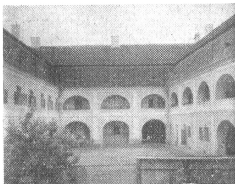
A Teleki-theca épületének belső udvara