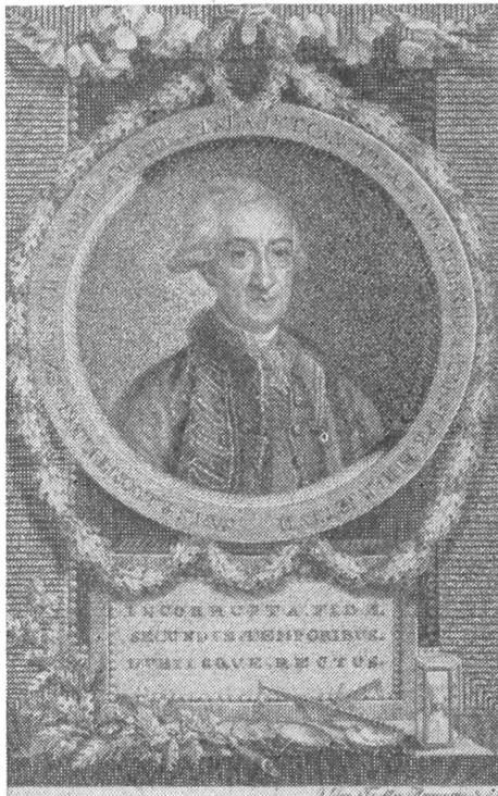
Teleki Sámuel arcképe

„Ifjúságotól fogva nagy költséggel, szorgalmatossággal és fáradsággal szerzett... könyveimet... hagyom és legálom, mint Házam- és Familiámbeli örökös Fidei Commissumot, Maradékiimnak és Successoraimnak gondviselések és jótállások alatt, a Tudományoknak Nemzetemben s Hazámban elő-mozdítások- ra...“ — írja végrendeletében gróf Teleki Sámuel erdélyi kancellár. A könyvek, melyek felett rendelkezett, már korábban is hatalmas értéket képviseltek; a kancellár a felvilágosult tudós hozzáértésével és a bibliofil gyűjtőszenvédélyével válogatta össze közel negyvenezer kötetnyi könyvtárát Európa minden részéből. Hivatali kötelezettségei miatt élete nagy részét külföldön, főleg Bécsben töltötte, de soha egy pillanatig sem feledkezett el magyar voltáról, erdélyi származásáról; korában ő a hazai tudományok legbőkezűbb mecénása, legbuzgóbb támogatója. Kazinczy elragadtatott sorokat szentel könyvtárának, Bod Péter neki ajánlja a Magyar A'henast, széleskörű levelezése eleven kapcsolatot tart fenn a kor csaknem valamennyi hazai írójával, tudósá-