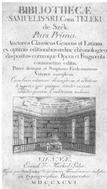
A katalógus első kötetének címlapja