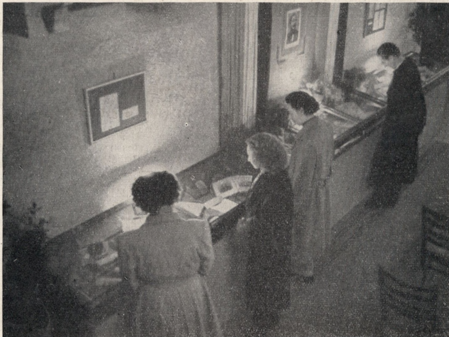
Kiállítás a székesfehérvári Megyei Könyvtárban a Vörösmarty-évforduló alkalmából