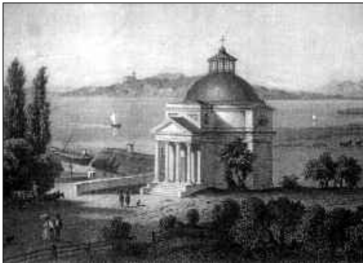
L. Rohbock metszete, 1855

Deák azonban nem lett hűtlen Füredhez a balul sikerült fürdőlátogatás ellenére sem. Hogy mennyire magának érezte a fürdőhelyet, az kiderül abból is, hogy – javító szándékkal – maga is javaslattal élt annak fejlesztése kapcsán. A füredi fürdő tulajdonosa, a bencés rend az 1830-as évek végén nyitotta meg az ún. Panaszok, javítások, szépítések, javaslatok jegyzőkönyvét . Ez nagyjából a ma is használatos panaszkönyveknek megfelelő füzet volt, ahova azonban a