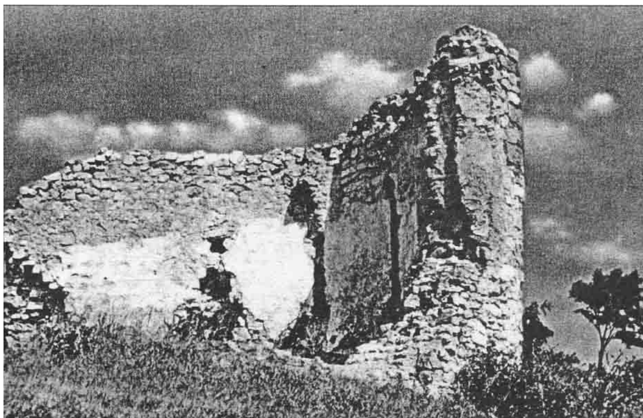
Papsokai templomrom (1956)