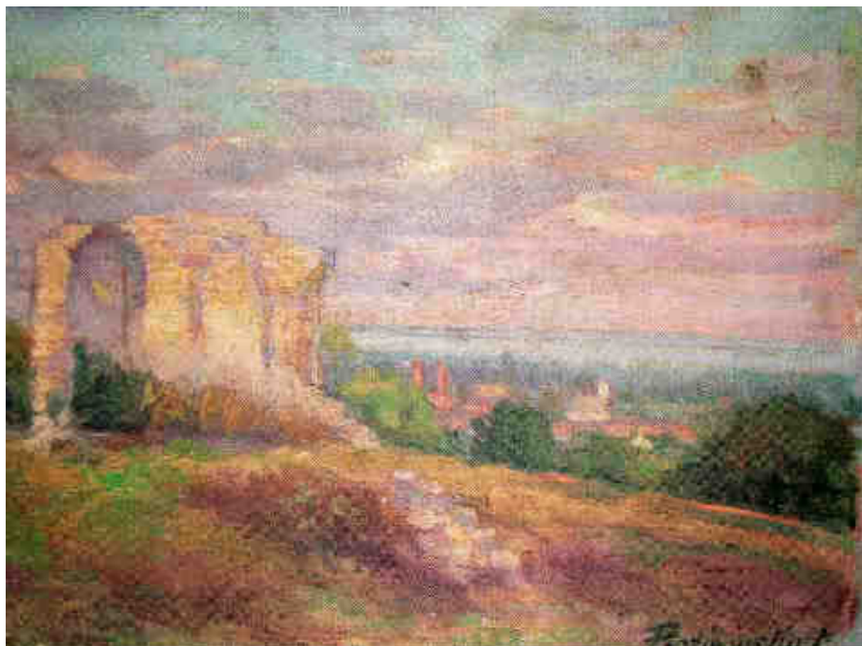
Protiwinsky Ferenc: Papsokai templomrom (Magántulajdon)