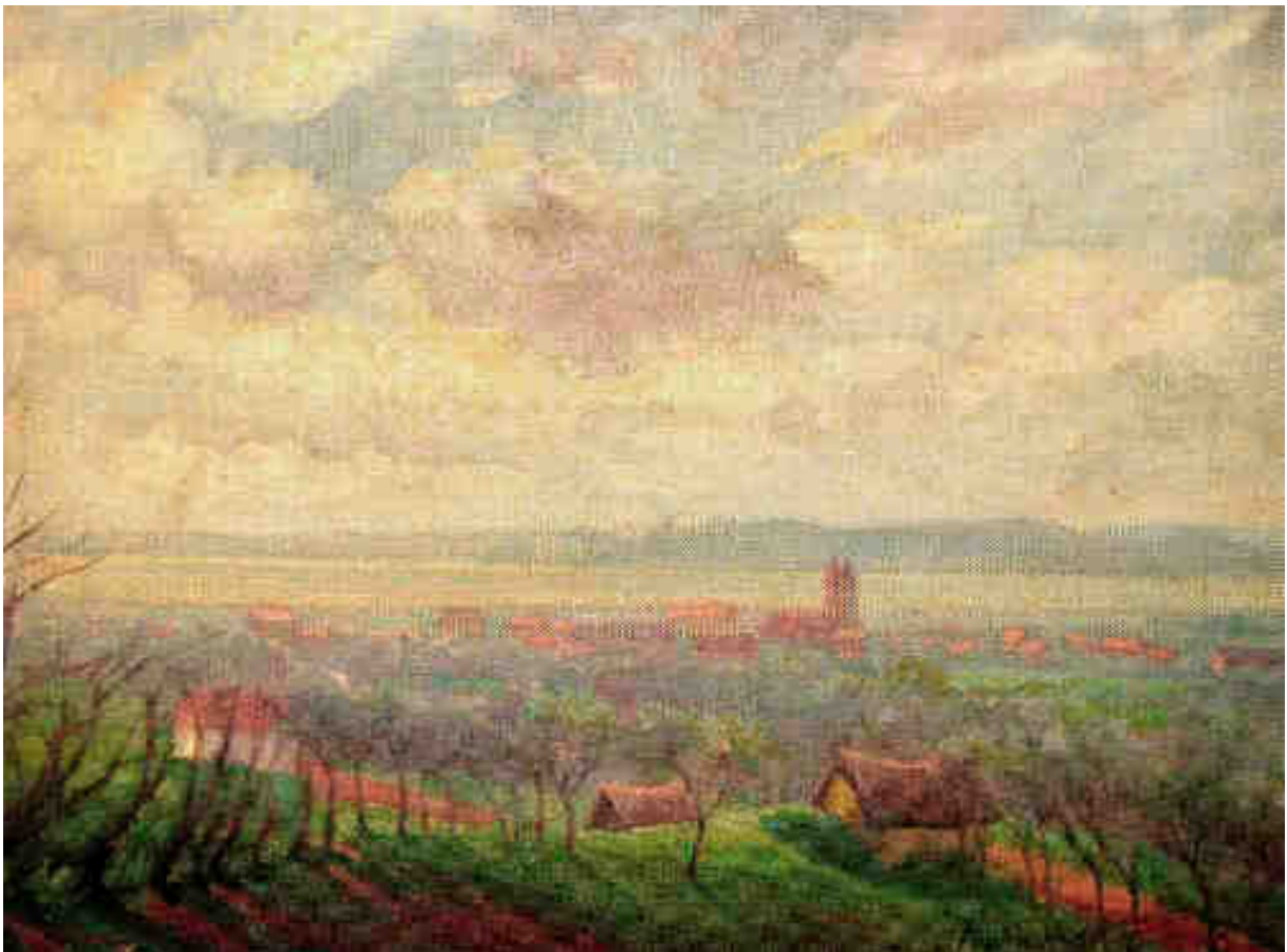
Protiwinsky Ferenc: Füredfalu a piros templommal (Magántulajdon)