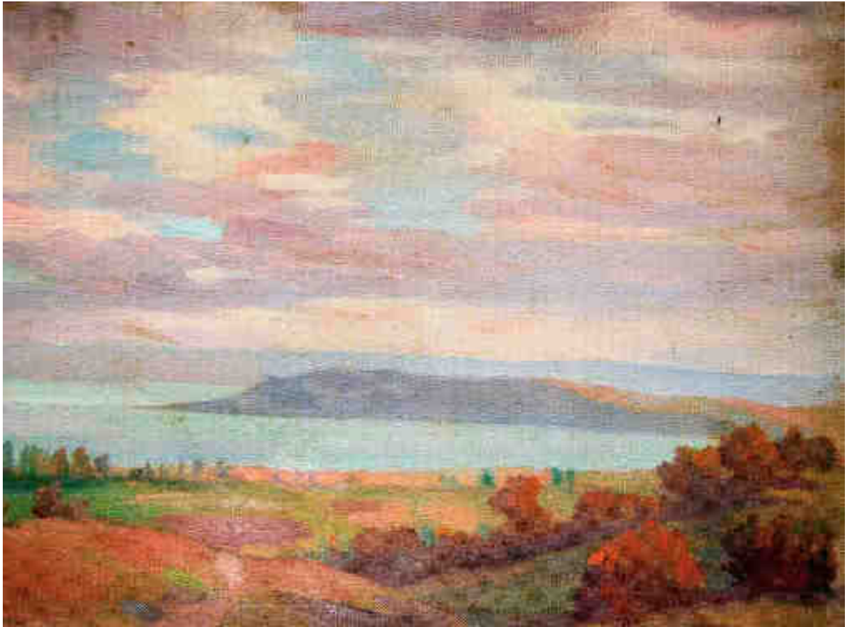
Protiwinsky Ferenc: Tihany (Magántulajdon)