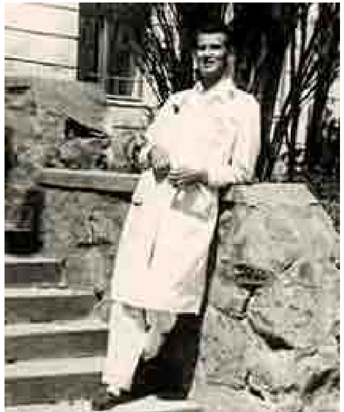
Szerző a Szívkórház előterében (1961-ben)

A Szívkórházban a betegek elhelyezése és gyógyítási viszonyaik is igen egyenetlenek voltak. A kórház profilja menet közben alakult ki, s arra a kérdésre, hogy milyen célokat is szolgáljon az intézet, véleményem szerint az illetékesek máig sem választottak megnyugtatóan. A kórház kezdetben utókezelési célt szolgált. Ahhoz, hogy ezt a feladatot képes legyen teljesíteni, az első igazgató-főorvosnak,