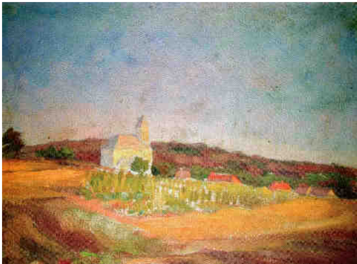
Protiwinsky Ferenc tájképe (Magántulajdon)