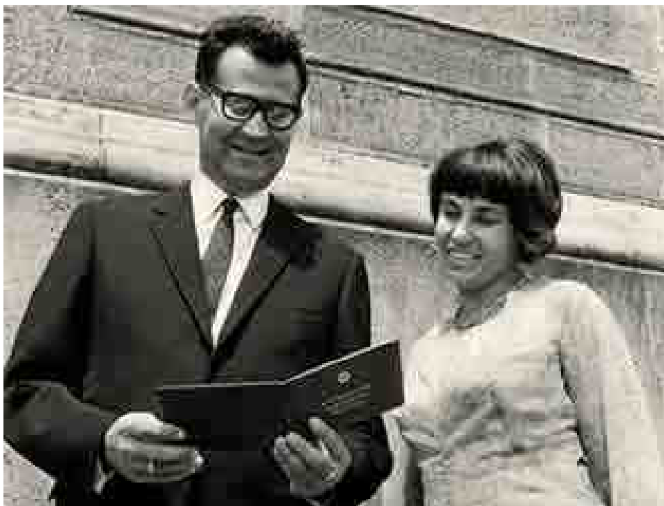
A szerző és felesége az MTA doktorává minősítése után (1969)