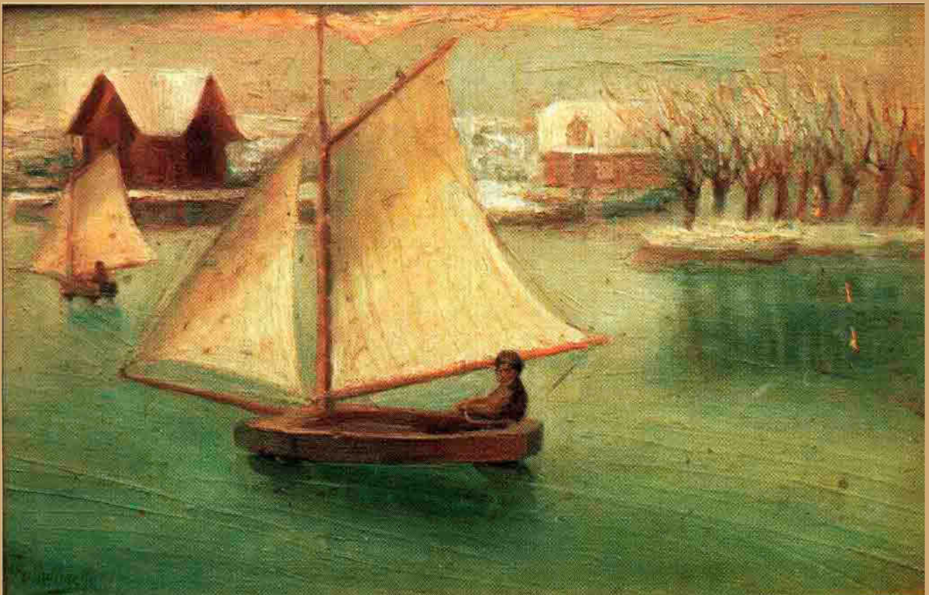
Protiwinsky Ferenc: Vitorlás szán a Balatonon (Magántulajdon)